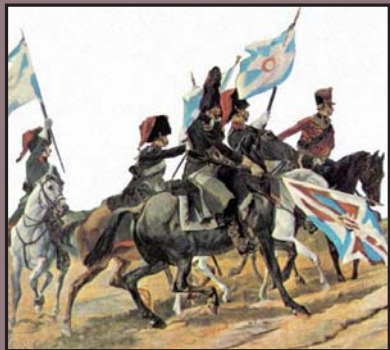
Jinetes franceses con banderas portuguesas capturadas.

El 6 de junio de 1808, llegadas la noticias desde España, Oporto se libera del yugo francés con ayuda de las tropas españolas allí acantonadas. Fue la señal para que todo el norte del país lo hiciera en el justo momento en el que desembarcaba una fuerza expedicionaria británica al mando del por entonces desconocido Arthur Wellesley, futuro Lord Wellington.