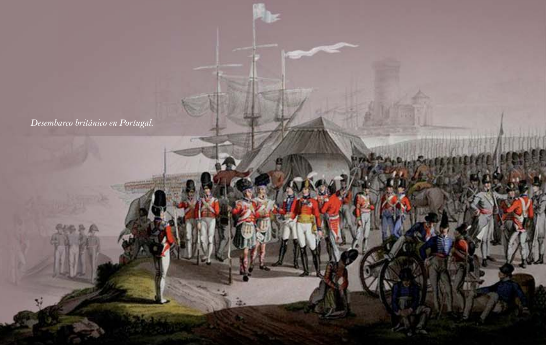
Desembarco británico en Portugal.

La reacción de general Junot fue reunir sus dispersas tropas para encarar la nueva amenaza, pero sus soldados fueron batidos primero en Roliça y más tarde en Vimeiro. Sin posibilidad de refuerzos y sin contacto con el resto de tropas en la Península, Junot optó por rendirse y firmó la controvertida Convención de Sintra, por la que los franceses fueron desalojados en barcos británicos y devueltos a las costas galas.