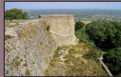
Castillo de Abrantes.

Desde allí nuestra ruta toma rumbo norte para conocer el trayecto de los ingleses y portugueses hasta el campo de la famosa batalla. Pasaremos por Roliça y Óbidos, donde los británicos combatieron a los franceses por vez primera en la Península, por Coimbra y Figueira da Foz, donde desembarcaron, y llegaremos a Oporto, núcleo de la sublevación que libertaría el país.