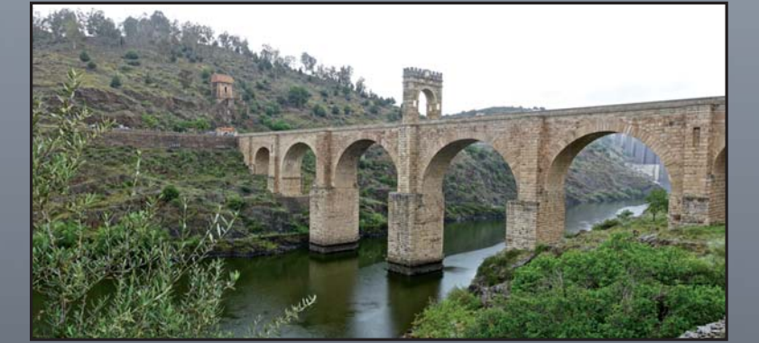
Puente de Alcántara.

El itinerario a seguir nos mostrará exposiciones para entender cómo fueron las Guerras Napoleónicas en la Península, como la exposición permanente 'Wellington frente a Napoleón' en Ciudad Rodrigo, el Museo Militar de Almeida y el Centro de Interpretación de la batalla de Vimeiro, momento culminante de la 1ª Invasión de Portugal.