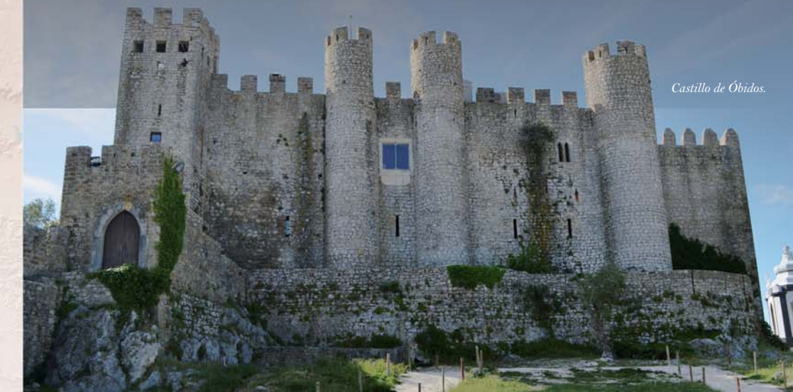
Castillo de Óbidos.