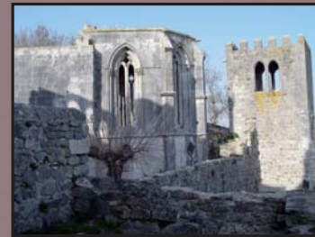
Castillo de Leiria.

Partiendo de Salamanca se inicia la Ruta 1ª Invasión de Portugal , que transita por el itinerario que siguieron los soldados ocupantes en 1807. Vira al sur en Guarda, tras entrar en Portugal, para retomar su camino al Oeste y alcanzar Abrantes, Santarem y Vimeiro, punto culminante de la campaña en la que Wellesley derrota a Junot.