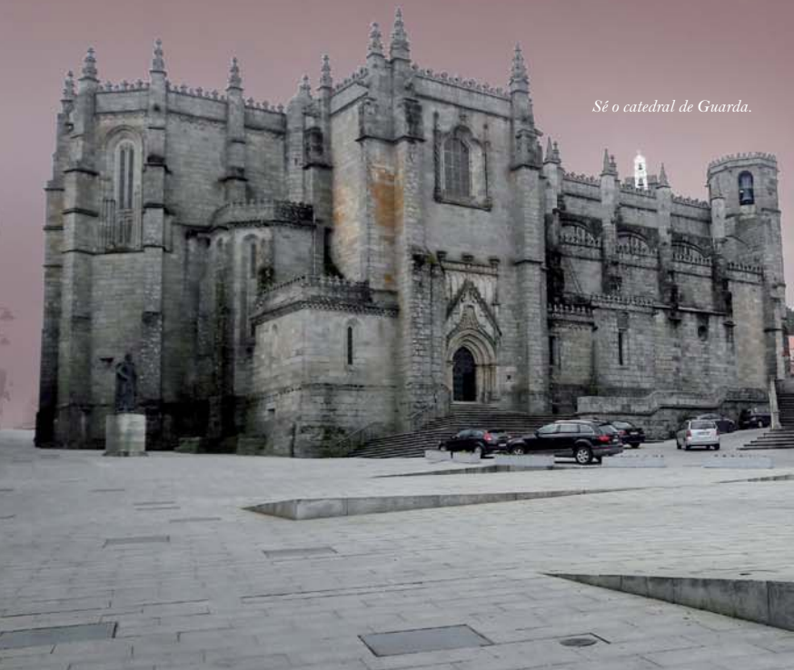
Sé o catedral de Guarda.