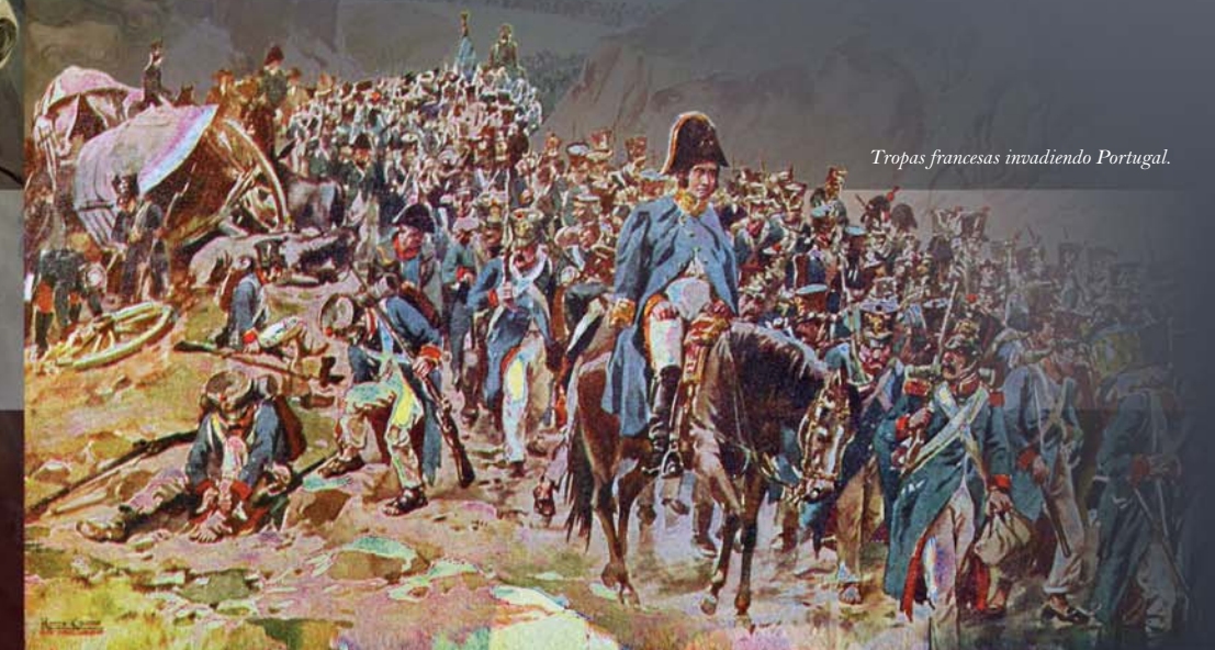
Tropas francesas invadiendo Portugal.

La ocupación de Lisboa fue rápida, pero no impidió que la Familia Real huyera a Brasil. Mientras, los acontecimientos en España se aceleraban y, tras el Dos de Mayo, comenzaron a producirse levantamientos que se contagiaron al país vecino. La resistencia portuguesa se reorganizó en torno a Oporto y esperó la ayuda prometida por Londres.