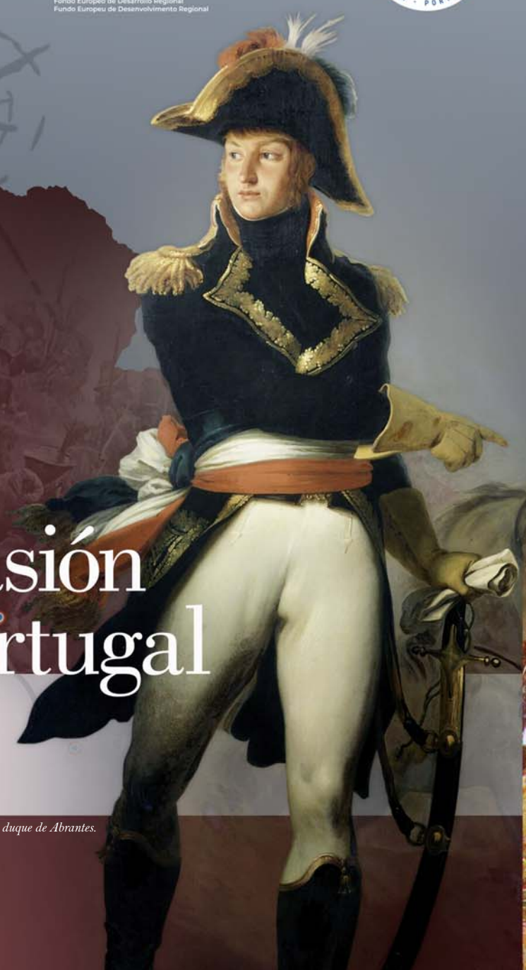
Jean-Andoche Junot, duque de Abrantes.

Franceses y españoles invadiendo conjuntamente Portugal. Ese es el insólito pero verídico comienzo de la Guerra Peninsular, si bien las tornas virarían ciento ochenta grados en los meses ulteriores.