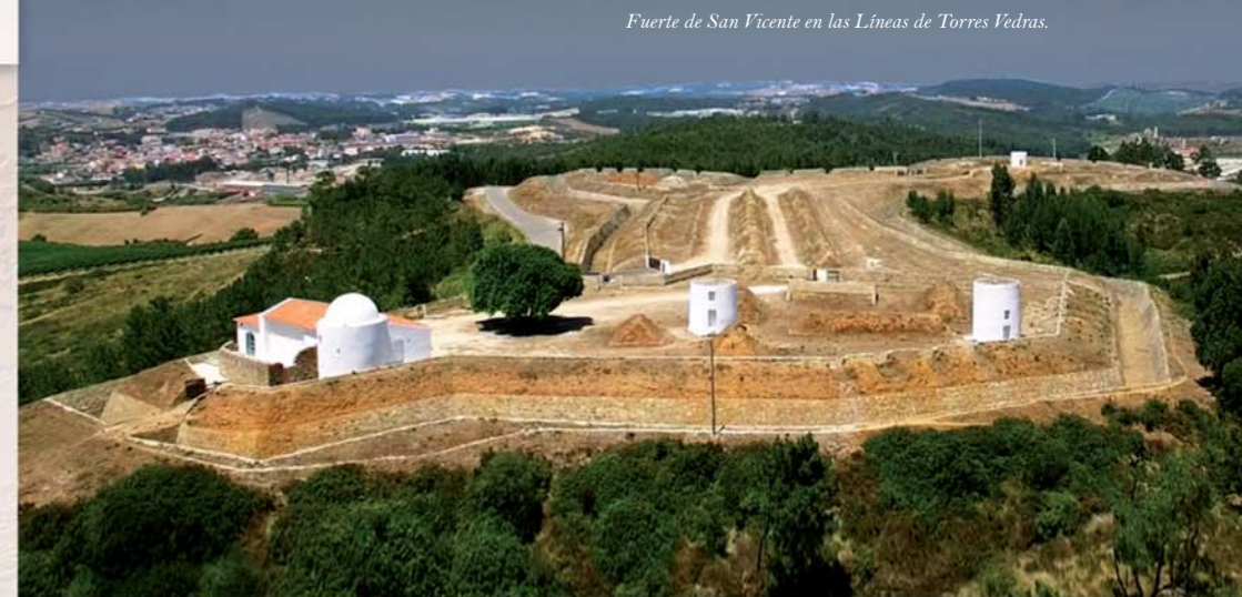
Fuerte de San Vicente en las Líneas de Torres Vedras.