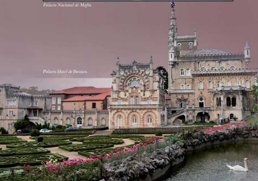
Palacio Hotel de Bussaco.