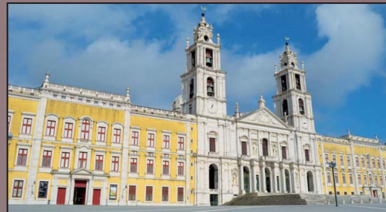
Palacio Nacional de Mafra.

La Ruta de la 3ª Invasión de Portugal está concebida como un trayecto de ida y vuelta. Partiendo de Salamanca nos desplazaremos hacia el Suroeste, siguiendo los pasos de los asaltantes, entrando en Portugal hasta llegar a las Líneas de Torres Vedras. Allí recorreremos diversos lugares de las dos líneas exteriores de grandes fortificaciones que protegieron exitosamente Lisboa durante el invierno de 1810 a 1811. Más tarde, tomaremos rumbo Norte hasta a Sabugal acompañando a las tropas aliadas que perseguían la retirada francesa una vez se convencieron de lo imposible de su causa.