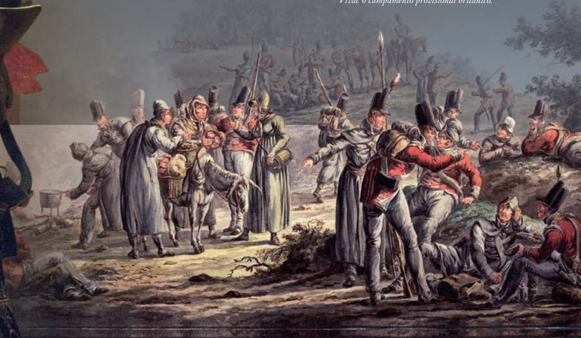
Vivac o campamento provisional británico.

Solo fue al llegar frente a las Líneas de Torres Vedras –dos anillos de colinas fortificadas cuidadosamente desde el cauce del río Tajo hasta el océano Atlántico más una última para cubrir una hipotético reembarque de las tropas en la flota británica- cuando el sorprendido mariscal del Imperio fue consciente de que su tarea era superior a sus recursos.