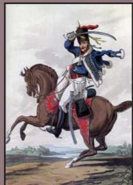
Caballería ligera británica.

Tras pasar el invierno a la espera de refuerzos con los que asaltar las Líneas, Masséna se convenció de la imposibilidad de su labor y, con sus soldados extenuados y prácticamente sin alimentar debido a la efectiva política de tierra quemada que había ordenado Wellington en su retirada, ordenó regresar a Salamanca. Las tropas aliadas persiguieron y hostigaron continuamente la retaguardia francesa que, magistralmente manejada por el mariscal Ney, consiguió el tiempo necesario para sus compatriotas en una serie de combates en Pombal, Redinha, Casal Novo, Foz de Arouce y Sabugal.