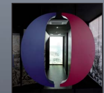
Centro de Interpretación "Mortágua en la Batalla de Bussaco".

Las Líneas de Torres Vedras conforman en sí mismas un atractivo turístico de primer orden, complementado con varios centros de interpretación -Fuerte de Alqueidão, Sobral, Torres Vedras- que nos darán una idea más certera de su propósito, construcción, funcionamiento y desempeño. También Bussaco, Mortágua, Almeida y Ciudad Rodrigo ofrecen recursos expositivos donde conocer la guerra y costumbres del periodo. El castillo de San Felices de los Gallegos y el Fuerte de la Concepción fueron testigos del enfrentamiento entre las tropas aquellos años; en este último podemos alojarnos, así como en el Parador de la vecina Ciudad Rodrigo, en el Palacio Hotel de Bussaco o en el Palacio Anadia en Mangualde.