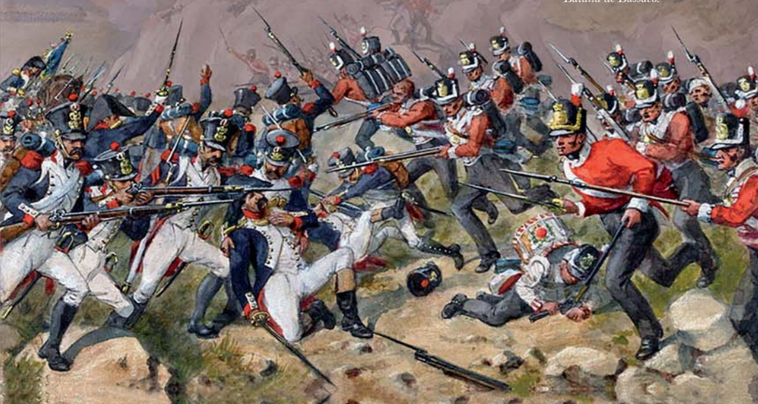
Batalla de Bussaco.

Una vez en España, el mariscal francés reestructuró sus tropas y, tratando de conservar Ciudad Rodrigo y Almeida, chocó contra el ejército aliado en la batalla de Fuentes de Oñoro, siendo repelido. A consecuencia de ello la fortaleza portuguesa fue evacuada y retomada por los aliados, completando así la liberación de Portugal.