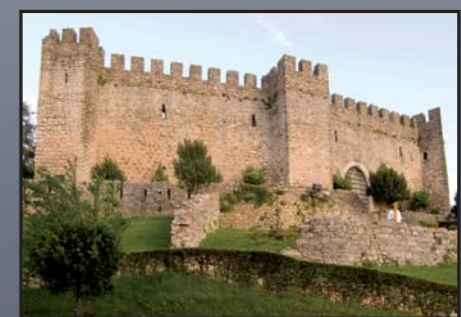
Castillo de Pombal.