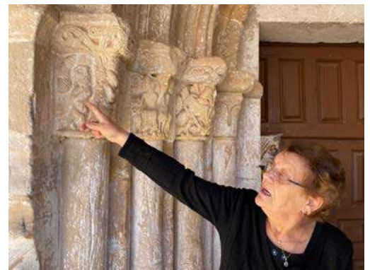
Detalle del pórtico

Eutimia Arranz lleva más de cuatro años siendo parte de “los custodios” un grupo de personas que, de forma voluntaria, muestran a los visitantes las maravillosas iglesias románicas de nuestro territorio.