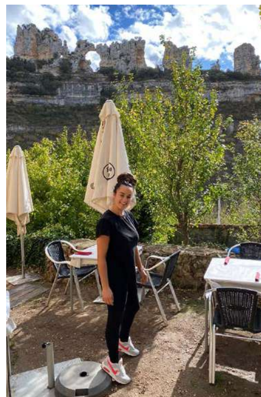
Ganadora del sorteo realizado entre los jóvenes que respondieron a la encuesta

Los resultados de la encuesta nos están indicando que este colectivo SÍ tiene ganas de participar y al mismo tiempo ya sabemos qué tipo de actividades prefieren o de qué clase de proyectos les gustaría formar parte. El siguiente paso será, para el próximo año, preparar una batería de propuestas de actividades y acciones en las que los jóvenes serán los protagonistas. Estad muy atentas y atentos para participar!!!!