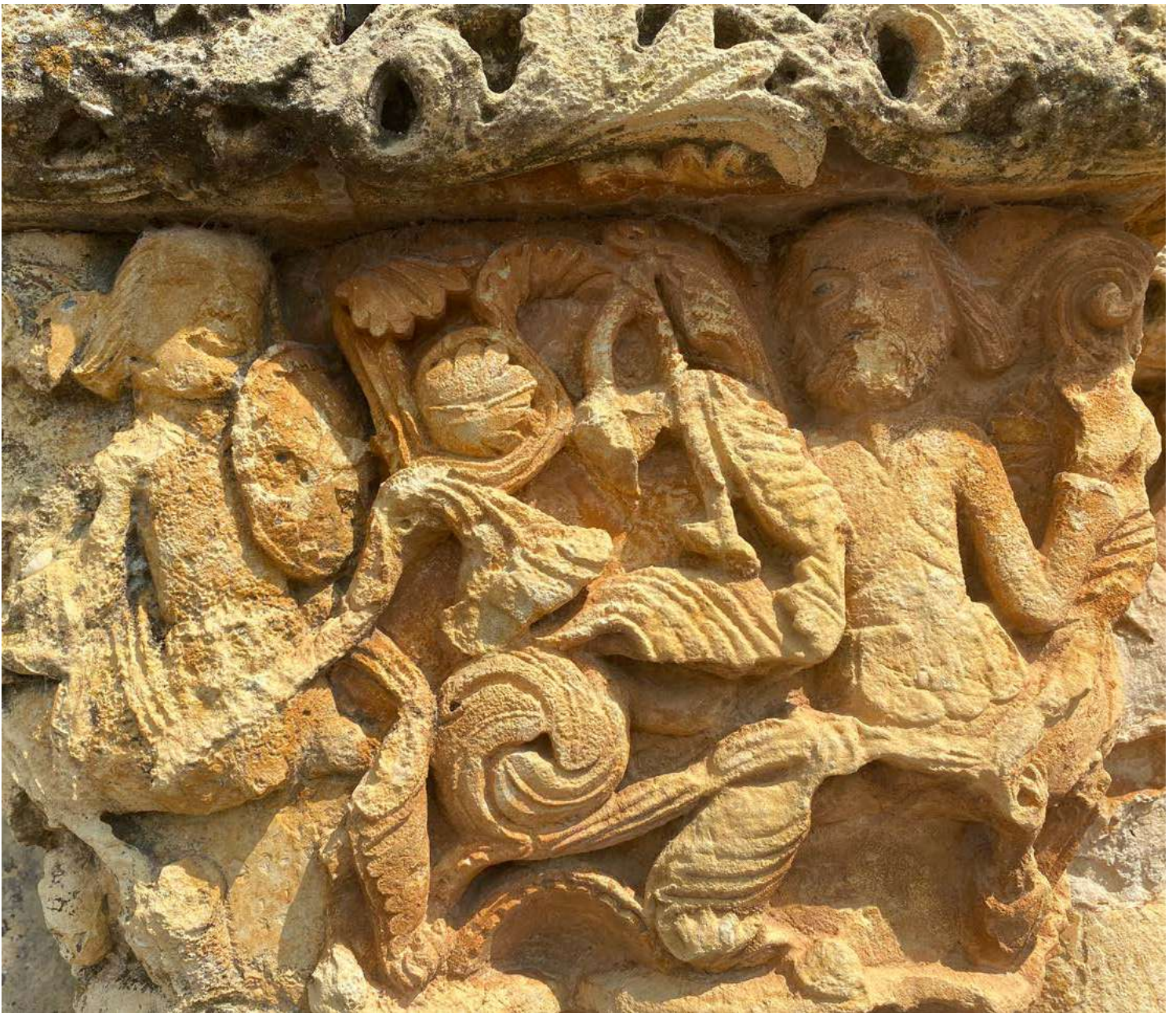
Detalle de un capitel de la Iglesia de Rebolledo de la Torre