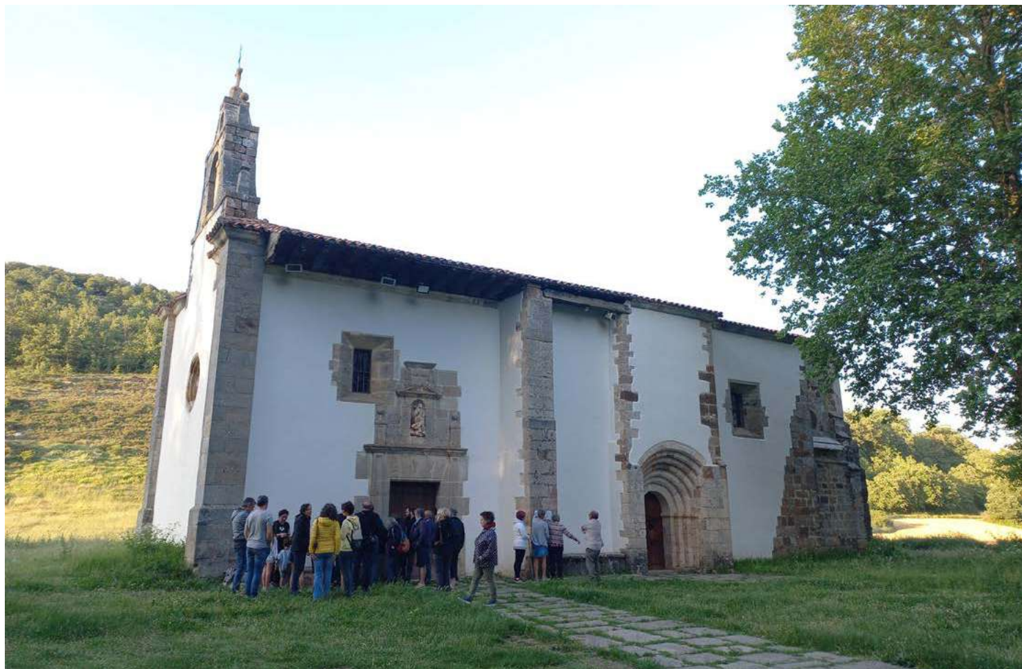
Observando las rocas y lo que nos cuentan

de roca empleados. El estudio paralelo sobre los afloramientos naturales del entorno próximo ha permitido constatar que se emplearon rocas locales, de km 0, para la construcción de estos templos.