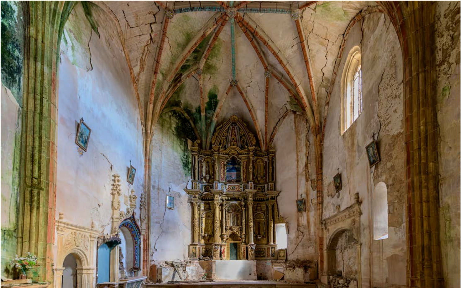
Altar Mayor de la iglesia