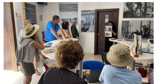
Museo del Petróleo en Sargentos de la Lora