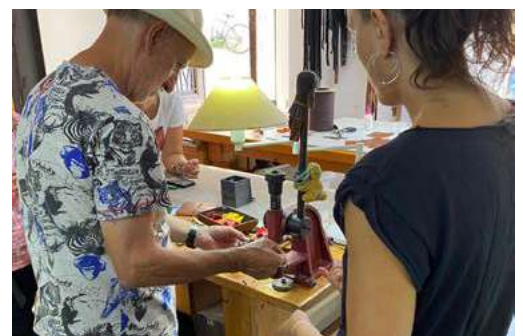
Taller de artesanía en piel Lora y Nube