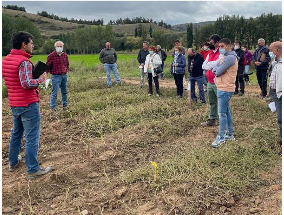
Jornada de formación sobre el cultivo de patata ecológica de siembra en los campos de ensayo con agricultores locales

Paralelamente se han organizado diferentes jornadas de formación para agricultores en las que se han mostrado las principales características de los modelos de producción agroecológica y donde se han realizado visitas de campo a fincas con producción ecológica entre ellas las utilizadas en estos campos de ensayo de patata de siembra.