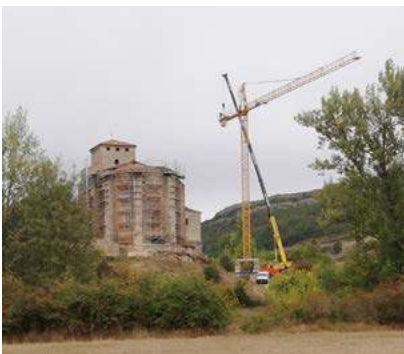
La Dama de las Loras en obras

como acertada y cariñosamente nos rebautilizaron a la iglesia, Fuenteodra y el territorio (visión globalizante sin la que el patrimonio por sí solo queda descontextualizado) se forjó un decidido y fuerte compromiso para hacer todo lo posible por revertir la situación.