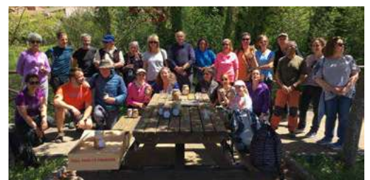
Cata de Miel de la Ecla