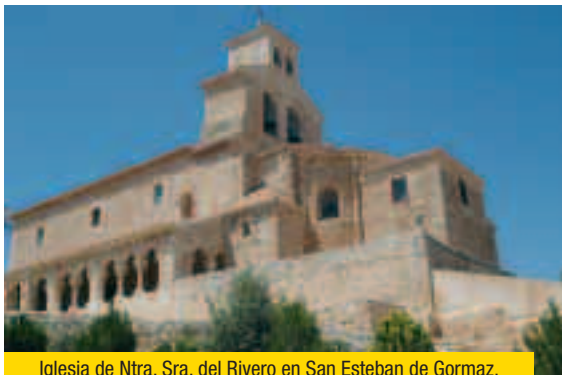
Iglesia de Ntra. Sra. del Rivero en San Esteban de Gormaz.

queda por restaurar su iglesia de Nuestra Señora de la Asunción quemada a consecuencia de un rayo en el año 1974, y OLMILLOS dan paso a la localidad de SAN ESTEBAN DE GORMAZ , una de las más relevantes de este Camino.