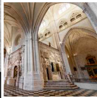
S. I. Catedral de Palencia