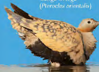
Ganga Ortega (Pterocles orientalis)

Villalmanzo nace en la Edad Media durante la repoblación mozárabe del Medio y Bajo Arlanza. Sus primeros años de vida no fueron fáciles, situado cerca de la frontera de la naciente Castilla sufrió como otros pueblos vecinos el acoso de los batallones moros, siendo arrasado hasta en tres ocasiones y quemado por las tropas de ocupación francesas, en su retirada, después de que fueran derrotadas en la batalla de Arapiles por el ejército anglo-hispano-portugués. De la quema se salvaron, entre otras, algunas casas del barrio de «Cantaranas», conocidas desde entonces como «Solás casas».