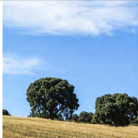
Campos de Villalmanzo

La gastronomía ocupa un lugar importante en la comarca del Arlanza. En Villalmanzo destaca el "chumarro", que consiste en bacalao desalado en trozos grandes, asado en las parrillas preferiblemente con madera de sarmiento, y posteriormente desmigado y cocido en aceite con ajos.