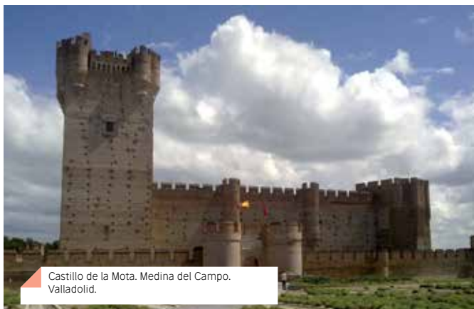
Castillo de la Mota. Medina del Campo. Valladolid.

destacan Nuestra Señora de las Angustias o el Nazareno de la Cruz. Medina del Campo cuenta con las procesiones de disciplina más antiguas de España de las que ya ha celebrado su VI Centenario y con este motivo inauguró el Centro San Vicente Ferrer como Centro de Interpretación de la Semana Santa de España.