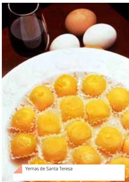
Yemas de Santa Teresa

Ávila, ciudad Patrimonio Mundial, mantiene las tradiciones de Semana Santa y, además, ha incorporado en los últimos años nuevos actos. Junto con el tradicional 'Vía Crucis' en torno a la muralla en las primeras horas del Viernes Santo, en fechas más recientes han visto la luz procesiones como la de la Estrella, que se suman a tallas de veterana devoción como el Cristo de Medinaceli o el de las Batallas que procesiona el Miércoles Santo, sin olvidar el Miserere del Martes Santo por la noche.