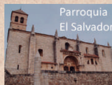
Parroquia El Salvador