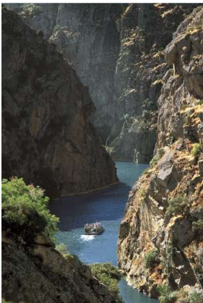
Cañón fluvial de los Arribes del Duero, Zamora

Un paseo en barco que no os podéis perder es el que recorre el cañón fluvial de los Arribes del Duero desde el embarcadero de Miranda do Douro. Os sentiréis como los vikingos surcando los fiordos castellanos. Es un paseo de una hora precioso, tranquilo, donde veréis aves y navegaréis entre los espectaculares acantilados verticales de hasta 200 metros de altura. ¡Es una maravilla! Durante el trayecto, los técnicos de la Estación Biológica interpretan los recursos etnográficos, fauna, flora y geología de los tremendos acantilados del parque, con lo que pequeños y mayores aprenderán muchas cosas. Tras su regreso a la Estación Biológica, la actividad incluye una degustación de vinos generosos de Oporto, visita a su Douro Valley Shop e instalaciones con nutrias y otras especies del Animal Therapy Program de la EBI. Después, como buenos exploradores, recomendamos buscar miradores para ver el cañón desde lo alto. Tenéis algunos preciosos en Fariza, Fermoselle, Villadepera, Villardiegua de la Ribera, Mámoles, Pinilla de Fermoselle, Abelón, Villaseco del Pan. Y no os perdáis las tremendas presas de Miranda, Bemposta, Picote, Villalcampo, y la impresionante presa de la Almendra, donde en 2018 se rodaron escenas de "Terminator 6". También rodaron allí escenas del "Doctor Zhivago" y «La Cabina». Teléfono Europarques-EBI: 980 557 557