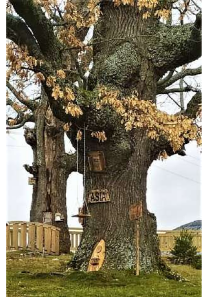
Ratoncito Pérez, Velilla del Río Carrión, Palencia