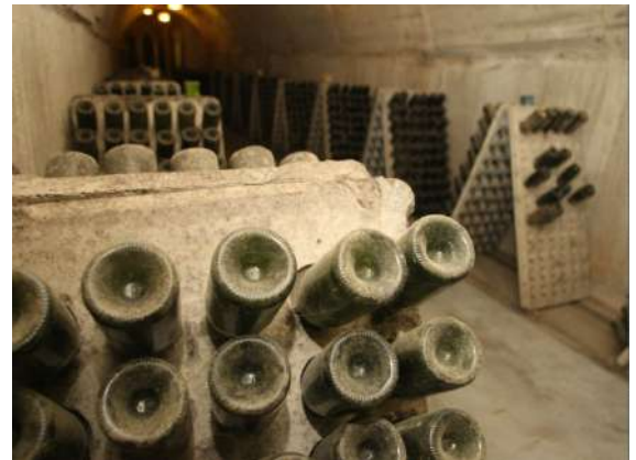
Vinos Espumosos, Rueda, Valladolid

La provincia de Valladolid cuenta con cinco denominaciones de origen (Ribera del Duero, Rueda, Cigales, Toro y León), dos denominaciones de vinos de pago (Urueña y Vizar), así como una indicación geográfica protegida (Vinos de la tierra de Castilla y León). Cada año se celebra en la capital el evento "Valladolid Plaza Mayor del Vino". Suele ser en el mes de mayo en el que se degustan los vinos de las 5 denominaciones de origen representadas por diferentes bodegas de la provincia junto con alimentos de Castilla y León. Este año 2022, también se ha celebrado en la ciudad del Pisuerga el concurso mundial de Bruselas, y la feria internacional de enoturismo FINE. Si visita Valladolid, no se puede perder su espectacular oferta enoturística, en la que no solo podrá visitar los maravillosos edificios de las bodegas, si no también degustar una buena comida con su gran maridaje en un entorno incomparable.