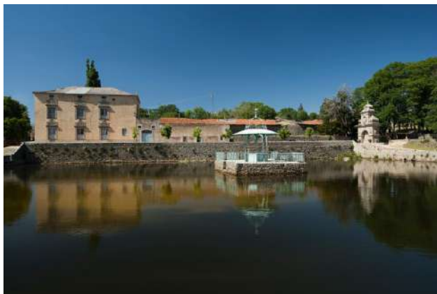
Jardín El Bosque, Bejar, Salamanca