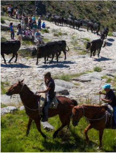
Trashumancia de la raza Avileña-Negra Ibérica Pto. del Pico, Ávila

Esta es una actividad al aire libre que tiene como escenario el Puerto del Pico. Consiste en el avistamiento de las vacas trashumantes procedentes de las dehesas extremeñas en su última etapa antes de llegar a casa. Las vacas avileñas recorren la calzada romana del Puerto del Pico hasta llegar al descansadero del mismo puerto donde se hace un encuentro con el fin de divisar la llegada de las vacadas trashumantes. Todo un espectáculo para la vista al que acompaña la imponente calzada romana por la que ascienden paso a paso las reses que hacen el camino de regreso a pie. Los asistentes pueden disfrutar al aire libre de una degustación de productos de la tierra. La trashumancia se practica en parte a pie, con desplazamientos de una media de 250 km entre las tierras de Extremadura, Castilla-La Mancha y Ávila y, en su mayor parte, en camiones. Algunos ganaderos van acompañados de sus caballos. Asociado a este evento tiene lugar el Concurso Fotográfico de la Trashumancia.