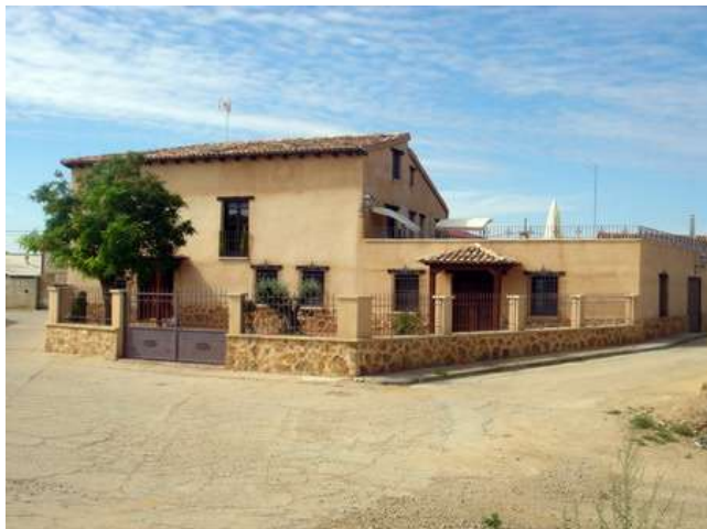
Posada Real del Canal, Villanueva de San Mancio, Valladolid