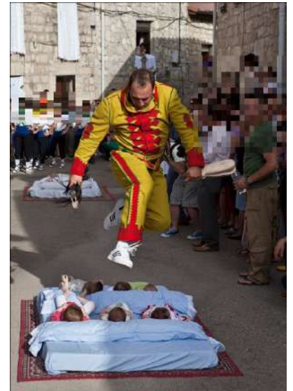
Fiesta del Colacho, Castrillo de Murcia, Burgos

Se celebrará en la localidad de Castrillo de Murcia (Burgos) el próximo 19 de junio. Fiesta de Interés Turístico de Castilla y León de carácter religioso que se asemeja a un auto sacramental. Se viene celebrando ininterrumpidamente desde principios del siglo XVII. En la que "El Colacho", personaje grotesco que representa al diablo, ataviado con un atuendo de brillantes colores y una máscara, fustiga con una cola de caballo a las gentes del pueblo que lo increpan. Salta por encima de niños menores de un año, para purificarles y alejar el mal de ellos. Tiene su precedente en las pantomimas y juegos de teatro romano de la Edad Media.