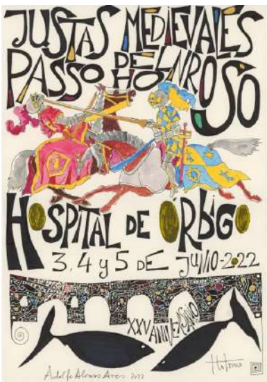
Justas Medievales Hospital de Órbigo 22

Hospital de Órbigo celebra el primer fin de semana de junio las "Justas Medievales del Passo Honroso", Fiesta de Interés Turístico de Castilla y León que reúne cada año a más de treinta mil personas. El torneo es uno de los actos centrales de las justas, paso previo a la batalla, junto con el desfile de pendones y caballeros, además de los bailes medievales, que protagonizan las damas, y la música popular. La tradición nos narra que en el año 1434 Don Suero de Quiñones solicitó al rey permiso para celebrar un torneo. Prisionero de amor por Doña Leonor, hizo una promesa por la cual tuvo que ayunar cada jueves y llevar una argolla de hierro en el cuello. El torneo duró cerca de treinta días, durante los cuales se propuso además romper, junto a nueve caballeros, más de 300 lanzas de nobles e hidalgos de toda Europa que pasaran por el lugar. Dos monolitos recuerdan su historia en el Puente Honroso de esta localidad que cruza el río Órbigo, uno de los más largos del Camino de Santiago. Las calles de la localidad se llenan esos días de damas, caballeros, mercaderes, reyes, bufones y monjes ataviados con sus mejores trajes. La fiesta finaliza el domingo con la celebración del Gran Torneo y la recreación de la victoria de Don Suero.