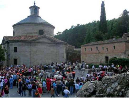
Romería de San Pedro de Alcántara, Ávila

Esta celebración tiene lugar cada 19 de octubre en honor a San Pedro, nacido en Alcántara (Cáceres) y cuyo nombre real es Juan de Garabito y Vilela, un fraile franciscano que llegó a ser consejero de Santa Teresa, a la que impulsó en su reforma del Carmelo. Tomó los hábitos en el convento de San Francisco de los Majarretes, cerca de Valencia de Alcántara, donde toma el nombre de Fray Pedro de Alcántara. Se conoce como Santuario de San Pedro de Alcántara al último convento que erigió el santo extremeño; fue en un sitio apartado del término de Arenas de San Pedro en el que había una ermita dedicada a San Andrés del Monte, junto a la cual, Fray Pedro de Alcántara mandó edificar un pequeño convento. En este lugar fue enterrado, siendo declarado patrón de Arenas de San Pedro con motivo de su beatificación y haciendo el pueblo voto de tener por día de fiesta perpetuamente el 19 de octubre de cada año. Hasta el santuario llegan todos los años miles de devotos tanto de Arenas como de toda la comarca teniendo en cuenta también a aquellos que se desplazan desde La Vera y de la campana de Oropesa. Acuden para cantar las alabanzas del Santo y sacar su estatua en procesión por el campillo. La peregrinación al santuario se efectúa andando o con caballos engalanados, realizándose también la subasta de los banzos. Esta romería cuenta con el reconocimiento de Interés Turístico de Castilla y León.