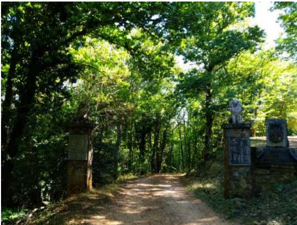
El Bosque de la Honfría, Linares De Riofrío, Salamanca