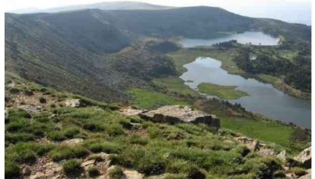
Lagunas larga y Negra (Parque Natural de las Lagunas de Neila), Burgos

El inicio del otoño nos sorprende en muchos de los bosques de nuestra provincia con un sonido gutural y realmente característico, se trata de la berrea que emiten los machos de ciervo en celo como demostraciones de poder para atraer a las hembras y que se compaginan con luchas rituales con otros machos, en las que utilizan su cornamenta. Los territorios preferidos son bosques en los que las hembras vayan a beber o alimentarse. Los machos ganadores en estos impresionantes combates reúnen harenes de hasta 50 hembras. En la Casa del Parque natural Lagunas Glaciares de Neila, nos pueden informar para disfrutar al máximo de esta experiencia tan singular, en la Sierra de la Demanda.