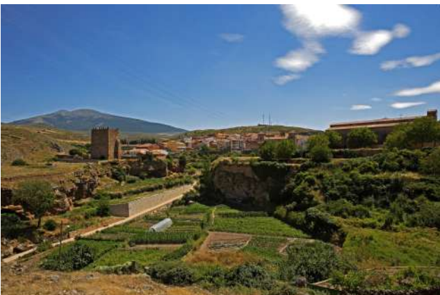
Moncayo y Agreda, Soria