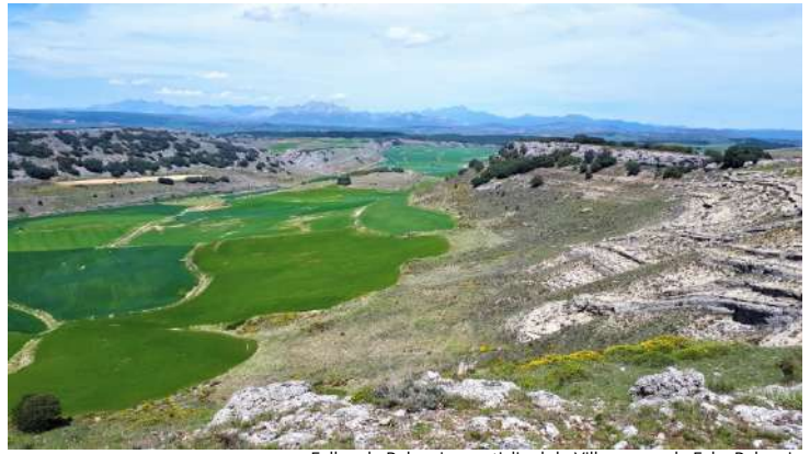
Fallas de Palencia y anticlinal de Villaescusa de Ecla, Palencia

La geosenda del anticlinal de Villaescusa de Ecla es uno de los itinerarios autoguiados que se pueden recorrer en el Geoparque Mundial de la UNESCO Las Loras. En este paseo, de unas dos horas de duración, descubrirás algunas de las características y paisajes más relevantes de este territorio. Así, podrás acceder a un singular mirador, desde donde tendrás una excepcional panorámica de la Montaña Palentina, pasear por un castro de la Edad del Hierro, recorrer un pliegue anticlinal parcialmente vaciado donde podrás observar la espectacularidad de las múltiples fallas que se localizan en torno a esta estructura geológica o, en épocas de lluvia, disfrutar de la belleza de la cascada de la Cervigada. Este paseo es circular, comienza y termina en la localidad de Villaescusa de Ecla donde podrás encontrar un panel con toda la información de esta georuta.