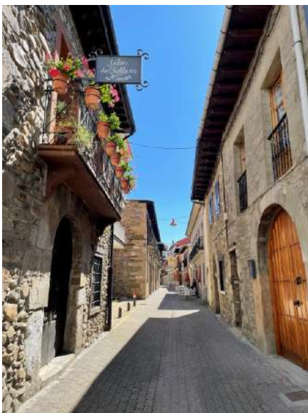
Calle Santa María, Cacabelos, León (cedida Oficina Turismo Cacabelos)

La villa de Cacabelos, en plena ruta jacobea, está configurada por la antigua calzada romana. En la Edad Media la localidad gozó de un crecimiento importante, como lo atestiguan su iglesia de Santa María, el Santuario de las Angustias con la venerada imagen de la Virgen de la Quinta Angustia o el cercano monasterio de Carracedo. La vida de esta localidad se articula en torno a la Calle de Santa María, donde se conservan los más importantes ejemplos de su arquitectura civil. Su puente sobre el río Cúa, construido en los siglos XVI y XVII, es uno de los más monumentales de la provincia. También sus bodegas dejan testimonio de la pujanza de la villa y nos invitan a conocer la D.O. del Bierzo, con variedades de uva de gran calidad. De gran relevancia en el municipio son los castros de La Edrada y Castro Ventosa, los dos son Bien de Interés Cultural. El yacimiento de Castro Ventosa, en Pieros, conserva la magnífica muralla de época Bajo Imperial Romana, el de La Edrada es interesante por haber sido asentamiento romano identificado como Bergidum Flavium y porque nos da a conocer la historia del territorio berciano. El abundante material obtenido en sus excavaciones se expone en el museo Arqueológico de la localidad, "MARCA", ubicado en un edificio de finales del siglo XIX con una magnífica galería de madera en su planta superior. Su colección permanente, además de la sección de arqueología, contiene una sala dedicada a la etnografía local.