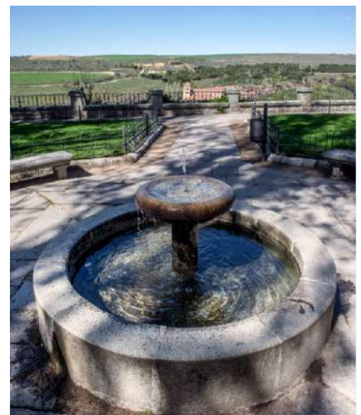
Jardín Fromkes, Segovia