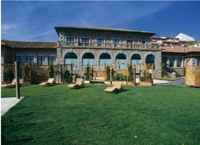
Posada Real El Linar del Zaire, Burgohondo, Ávila