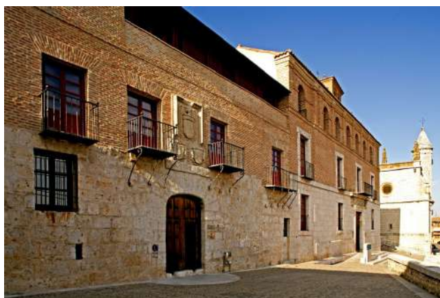
Casa del Tratado de Tordesillas, Valladolid

Localidad con un importante pasado histórico y un presente monumental, declarada conjunto histórico artístico. La plaza mayor, construida en el siglo XVI, con forma cuadrada, soportales y edificios con balcones y grandes ventanales, conserva la arquitectura tradicional castellana. Uno de los edificios más importantes, es la casa del Tratado, ya que el 7 de junio de 1494, se firma el tratado de Tordesillas, mediante el cual las tierras del nuevo mundo se dividían entre España y Portugal. El real Monasterio de Santa Clara, construido en el año 1340 por Alfonso XI, se edificó como un palacio mudéjar terminándolo de construir su hijo, Pedro I y cediéndolo este más tarde a sus hijas, las cuales lo convirtieron en un convento de clarisas. Aquí permaneció Juana I de Castilla durante los últimos 46 años de su vida y es donde fue enterrada hasta su traslado a Granada. Merece la pena ver la iglesia gótica al igual que los baños árabes (anexos al edificio, cuyo estilo es similar al de la Alhambra de Granada). No hay que perderse el impresionante puente medieval, la estatua de Juana I, los jardines del palacio y el mirador de Bellas Vistas, así como el museo del encaje de Castilla y León.