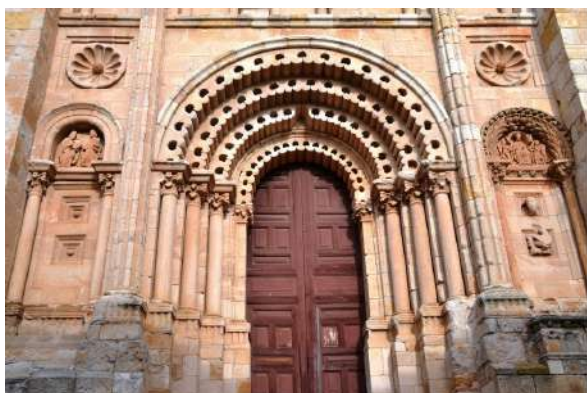
Portada Sur Catedral de Zamora