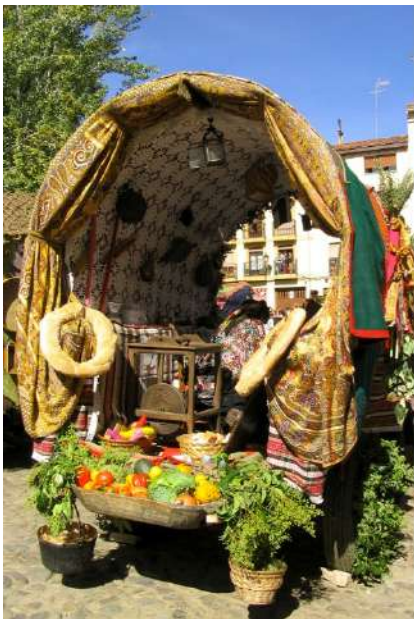
Fiesta de San Froilan, León

Las fiestas más singulares de la ciudad de León se celebran en honor al patrón de la diócesis de la localidad, San Froilán. El domingo anterior al 5 de octubre, festividad del Santo, dan comienzo festejos con diferentes celebraciones que llenan de color y tradición el centro de la ciudad. La fiesta de "Las Cantaderas", de Interés Turístico de Castilla y León, se celebra en el claustro de la Catedral y se asemeja a la original, en la que las jóvenes "cantaderas", ataviadas a la usanza medieval, bailan al ritmo de la "sotadera", en desfile desde la plaza del Ayuntamiento con la corporación municipal. El desfile y concurso de Carros Engalanados, reúne unos 50 carros de diferentes lugares de la provincia, con sus mejores galas para rememorar la tradición de ir en romería a la Virgen del Camino. El paseo se inicia en la avenida de los Cubos para llegar a la Plaza del Grano, donde se realiza el concurso, en el que gana el carro más original y con la decoración más cuidada. El desfile de Pendones es otro de los eventos más destacados del día. Estos grandes estandartes representan los diferentes concejos de León, procedentes de distintos puntos de la provincia y acompañados por bandas tradicionales son portados desde San Marcos hasta la Plaza Mayor. También durante esos días se celebran en la ciudad actividades como: El mercado medieval de las Tres Culturas, Feria de la Morcilla, Feria de Alfarería, Festival Celta Internacional, los pasacalles, etc.