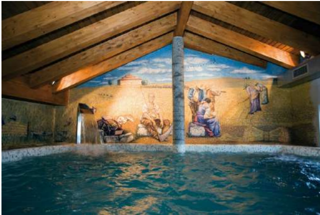
Posada Real Los Condestables, Villalpando, Zamora