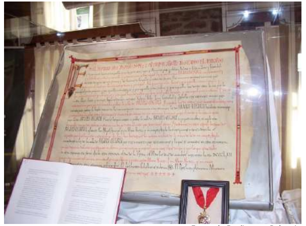
Fuero de Brañosera, Palencia

Brañosera es un pueblo precioso de la Montaña Palentina, considerado el Ayuntamiento más antiguo de España como se atestigua en la carta del fuero concedido el 13 de octubre del año 824, que cita a esta villa con el nombre de Brannia-Ossaria, que significa tierra de brañas (pastos) y de osos. La carta fue concedida por el Conde Munio Núñez y su mujer Argilo para fomentar la repoblación de esta zona, concediendo a sus súbditos derechos tales como el libre uso de todo el valle, eso sí, con dos condiciones, la primera dar parte de ese uso al que quisiera venir a poblar el valle, y la segunda dar la mitad de la paga que cobraran a los habitantes de las villas cercanas por dejar pastar en estos terrenos al ganado. La carta se conserva en el ayuntamiento de Brañosera y se puede visitar de forma gratuita previa cita telefónica 979 606 277 en horario de 11.00 a 14.00