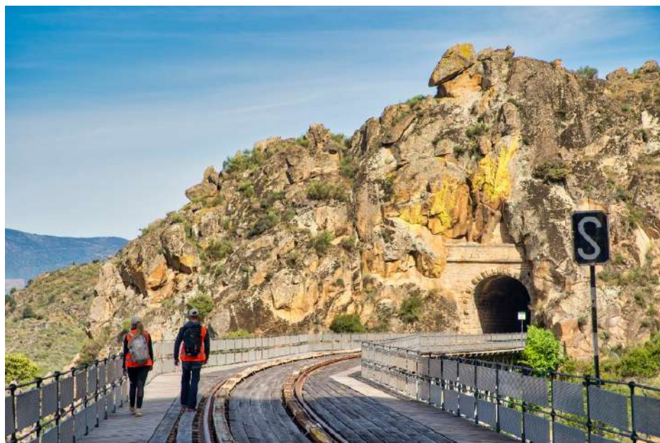
Ruta de la línea férrea de la Fregeneda. Camino de Hierro. El puente de Poyo Valiente, y tunel 7 del Pico, Salamanca