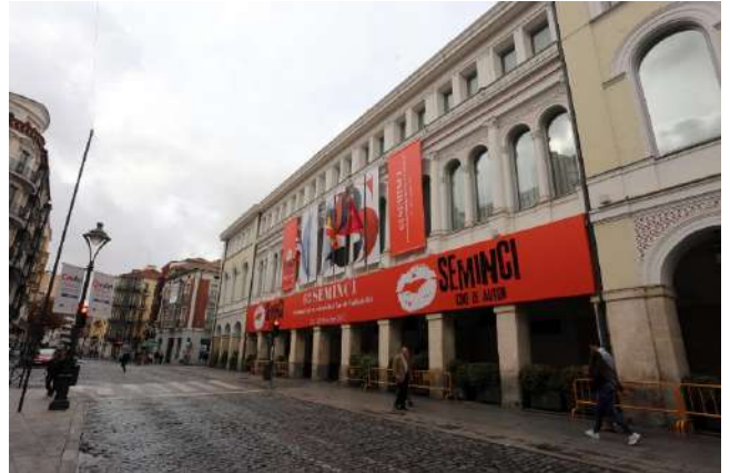
Teatro Calderón, Valladolid

La Semana Internacional de Cine de Valladolid es uno de los eventos cinematográficos más importantes de España, donde se dan cita los estrenos más novedosos del séptimo arte. Tiene lugar en el mes de octubre en el Teatro Calderón como sede principal. La primera edición se celebró el 20 de marzo de 1956 y se vinculó a la semana santa, como semana de cine religioso, pero la falta de este género de películas llevó a su evolución hasta lo que se ha convertido hoy en día. Durante este festival internacional de cine, Valladolid se llena de vida y de amantes cinéfilos, lo que la hace una buena época para venir a visitar la ciudad. Uno de los premios más importantes entregados en este evento es la espiga de oro y el reconocimiento en el séptimo arte. Algunas de las películas que han ganado este premio son tan conocidas como: Alguien voló sobre el nido del cuco (Milos Forman), La naranja mecánica (Stanley Kubrick) o Thelma y Louise (Ridley Scott).