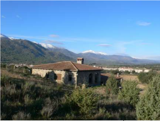
Museo de la Naturaleza Valle del Alberche en El Barraco, Ávila

El Museo de la Naturaleza Valle del Alberche nos muestra la biodiversidad de este enclave. Cuenta con una exposición permanente en la que se puede admirar fauna, vegetación y hongos presentes en la comarca, distribuida en el vestíbulo y cinco salas: Sala Principal, Sala del Bosque, Sala del Río, Sala de la Caza y la Pesca y Sala de la Noche. Esta exposición posee alrededor de 500 piezas con réplicas artísticas a escala real, ambientaciones naturales, maquetas, diferentes muestras biológicas en vitrinas, una colección de minerales de la zona, recreaciones naturalizadas y audiovisuales. También se realizan exposiciones temporales. En el exterior del museo hay dos sendas temáticas: Senda Botánica y Senda Micológica. Cuenta también con un Observatorio de Aves. El museo organiza diversas actividades algunas de ellas dirigidas al público infantil, publicando un boletín de actividades mensual.