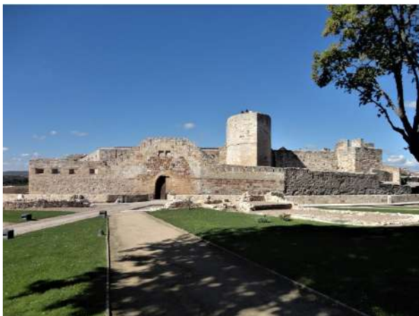
Castillo de Zamora