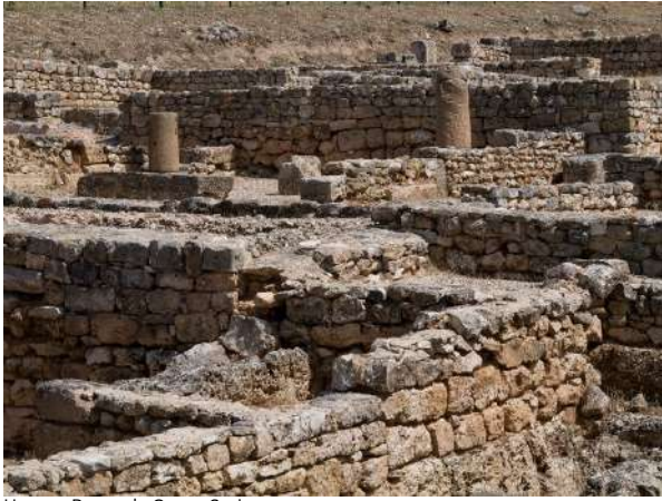
Uxama, Burgo de Osma, Soria