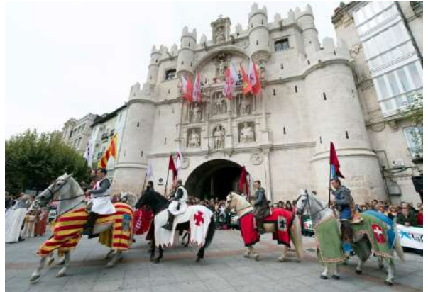
Fin de Semana Cidiano, Burgos

El personaje burgalés más universal es sin duda Rodrigo Díaz de Vivar, el Cid Campeador. En su honor en la ciudad de Burgos se organizan varios días de eventos vinculados con su figura y el mundo medieval al inicio del otoño, este 2022 la fiesta recibe el nombre de Burgos Cidiano 'El Regreso' y se celebra del 29 de septiembre al 2 de octubre. Burgaleses y visitantes se sumergen en el siglo XI, de la mano del burgalés más legendario. Con el centro histórico de la ciudad convertido en un gigantesco parque temático medieval engalanado con banderas y pendones, y recorren calles llenas de animación, desfiles, batallas y cientos de participantes de asociaciones relacionadas con el Cid Campeador y la Edad Media.