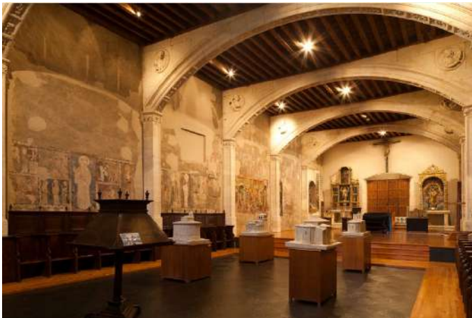
Convento y Museo de Pintura Medieval de Las Claras, Salamanca