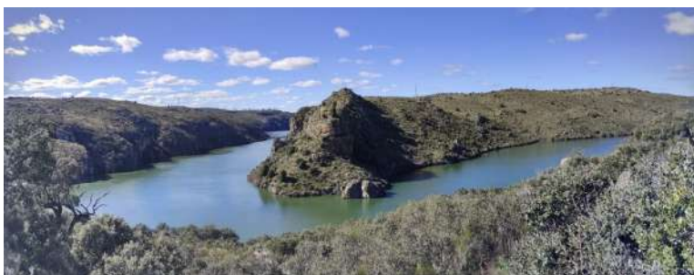
Mirador de Peñalcarro, Villaseco del Pan, Zamora