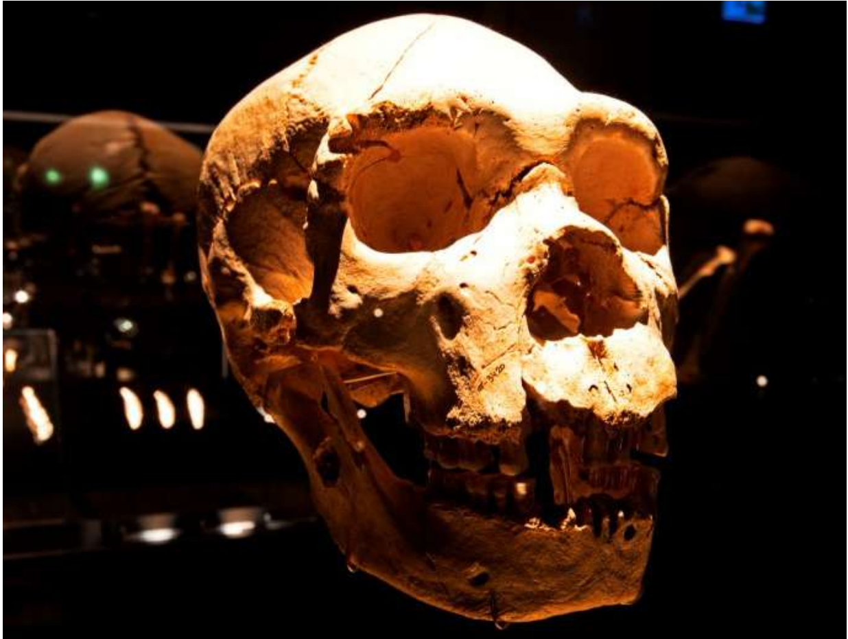
Homo Antecessor, cráneo de Miguelón