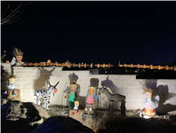
Belén del CITEs (Centro Internacional Teresiano Sanjuanista), Ávila