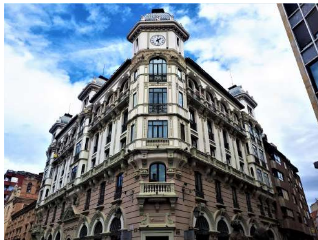
Modernismo en Palencia