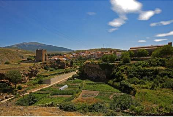
Moncayo y Ágreda, Soria