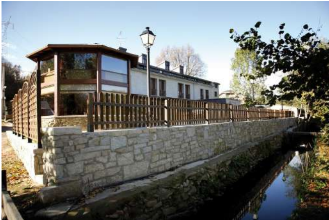
Posada Real La Yensula, Puebla de Sanabria, Zamora