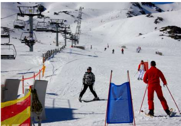
Estaci3n esquí San Isidro, León

El Parque Regional de la Montaña de Riaño y Mampodre es uno de los enclaves montañosos más sobresalientes de la cordillera Cantábrica. Ubicado en el noreste de la provincia de León, ofrece lugares únicos para el disfrute del deporte y de la naturaleza durante la época invernal. Esquí alpino, de travesía y fondo, snowboard o caminar en raquetas de nieve, mushing o backcountry son algunos de los deportes que practican en la zona. Las Casas del Parque de Lario y Puebla de Lillo ofrecen al visitante toda la informaci3n sobre el territorio, sus recursos y posibilidades, así como la amplia oferta de actividades y rutas disponibles. Puebla de Lillo es referente para los aficionados al esquí, centralizando buena parte de la oferta de alojamientos y servicios relacionados con la estaci3n de San Isidro. Desde allí podemos dirigirnos por el puerto de Las Señales y a Tarna, donde las vistas panorámicas son espectaculares. En Cofiñal hay magníficos rincones y rutas de senderismo como la ruta del Pinar de Lillo, circular y de baja dificultad, pero su acceso es restringido, siendo necesaria una autorizaci3n a través de la mencionada casa del parque. El turismo familiar también cobra auge en esta época invernal, donde la tradicional Cabalgata y descenso de antorchas (sector Cebolledo) hacen que la noche de Reyes sea aún más especial.