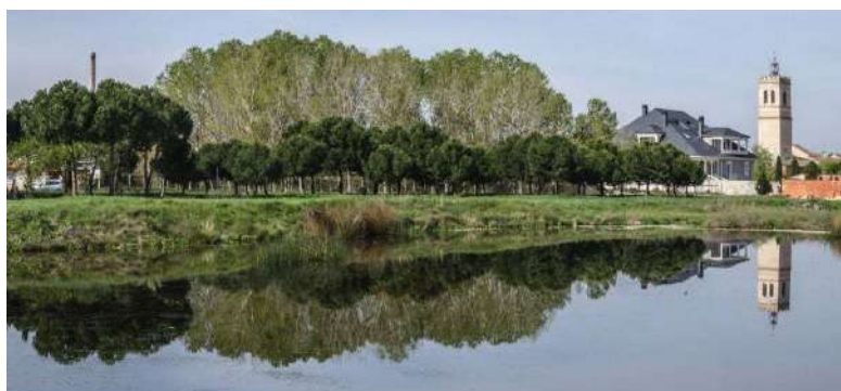
Navas de Oro, Segovia

Al oeste de la provincia de Segovia, en la Tierra de Pinares, se encuentra Navas de Oro. Su nombre es posible que provenga de sus lagunas cercanas, llamadas "navas". Éstas pueden ser depresiones en el manto arenoso que generan suelos más productivos en zonas bajas del terreno, que se inundan en épocas de mucha lluvia o también pueden deberse a la extracción de barro para fabricar adobes, para su venta o para la construcción de casas. Las tres lagunas consideradas declaradas zonas húmedas de interés especial de este municipio son: Pero Rubio, la Magdalena y la Vega. Pero estando en "Tierra de Pinares", su actividad principal consistía en la extracción de la resina. No podemos dejar pasar su perfil con las chimeneas industriales, hechas en ladrillo rojo y alcanzando hasta los 40 metros de altura o visitar el Museo de la Resina. En éste, descubriremos esta actividad hoy en día casi desaparecida, explicándonos las técnicas, materiales hechos con resinas, maquetas donde se refleja la división del monte, las pegueras y las antiguas fábricas de resinas. También son de interés la iglesia de Santiago Apóstol, la ermita del Cristo del Humilladero, la Casa Consistorial, la Torre del Reloj o el caserón de Los Mesa.