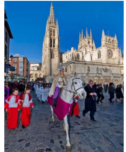
Fiesta del obispillo, Burgos