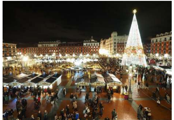
Plaza Mayor, Valladolid

En Valladolid es obligatoria la visita a la Plaza Mayor, con su mercado navideño donde se pueden encontrar todo tipo de productos artesanos (dulces, joyería,...) entre otras muchas cosas. También los carruseles instalados en varias zonas de la ciudad y el Tiovivo de la Plaza Mayor junto con la programación de los teatros, hacen el deleite de los más pequeños. No nos podemos olvidar de los belenes vivientes ubicados a lo largo de toda la geografía de la provincia y del belén napolitano del Museo Nacional de escultura, así como el de la Casa de Zorrilla. Para terminar, destaca por su fama la Cabalgata de Reyes, así como los diferentes conciertos natalicios. Si nunca has venido a Valladolid a pasar unas navidades, te invitamos a que lo hagas y que conozcas la época más maravillosa del año en una espectacular ciudad, ¡¡¡Feliz Navidad!!!