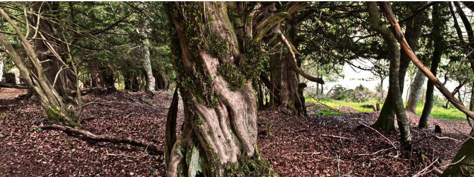
Tejada de Tosande, Palencia