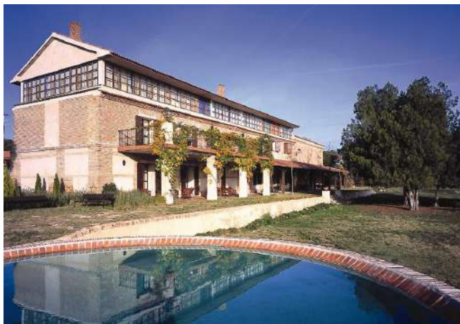
Posada Real La Posada del Pinar, Pozal de Gallinas, Valladolid

Si buscas una experiencia de completa inmersión en la naturaleza y la autenticidad de Castilla y León, te recomendamos las Posadas Reales inuestra marca de calidad dentro del Turismo Rural! No sólo te alojarás en edificios singulares, sino que la excelencia del alojamiento y del trato están garantizadas! Una estancia perfecta para vivir una experiencia inolvidable y sumergirte en todas las actividades, patrimonio y naturaleza de Castilla y León.