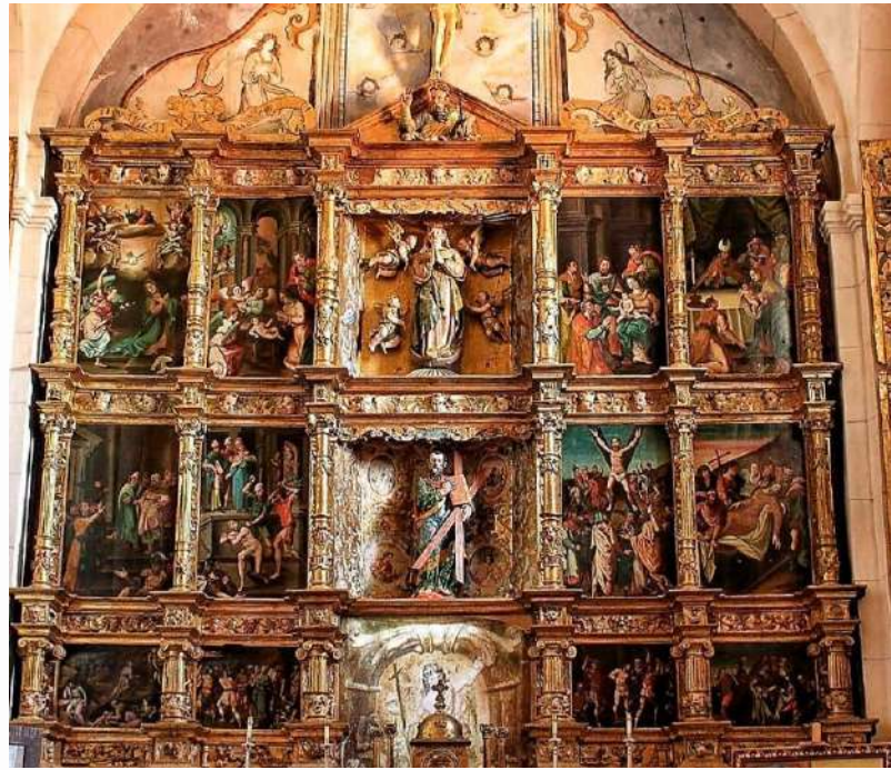
Retablo de la iglesia de Valdescapa, León

En el interior de alguna de las muchas iglesias que encontramos en los numerosos pueblos de la provincia de León podemos encontrar verdaderas maravillas, auténticas obras de arte sacro. Diez de ellas configuran “la Ruta de los retablos renacentistas del este de León”. 76 kilómetros unen las localidades de Vallecillo, Gordaliza del Pino, Sahagún, Joara, Celada de Cea, Valdescapa de Cea, Villaselán, Valdavida, Cistierna y Yugueros; la Ruta atraviesa los valles de los ríos Esla, Cea y Valderaduey. Esta ruta por los diez pueblos permite también conocer la gastronomía local y sus diferentes tradiciones.