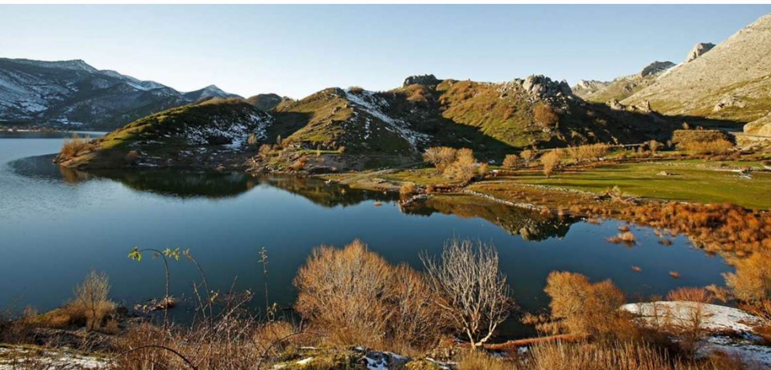
Valle de Luna. León

Las Reservas de la Biosfera son áreas designadas por la UNESCO, en el contexto del Programa MAB (el Hombre y la Biosfera), con el objetivo de ensayar formas de armonizar la conservación de los recursos naturales con el bienestar de las comunidades humanas.