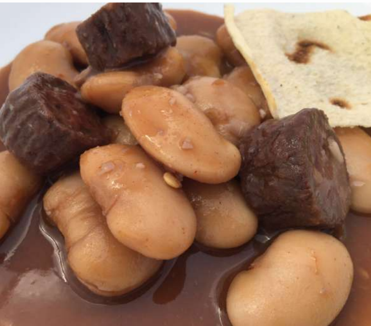
Plato de Judiones.