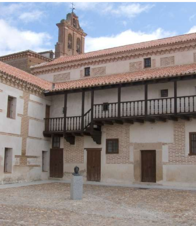
Monasterio de Nuestra Señora de Gracia, Madrigal de las Altas Torres, Ávila