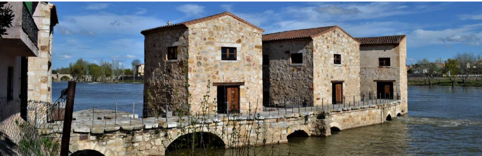
Aceñas de Olivares, Zamora