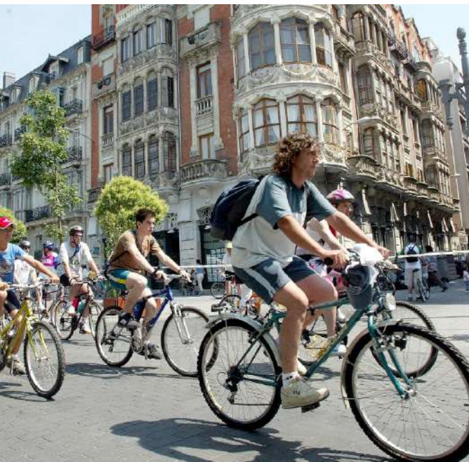
Celebración en Valladolid del Día de la Bici