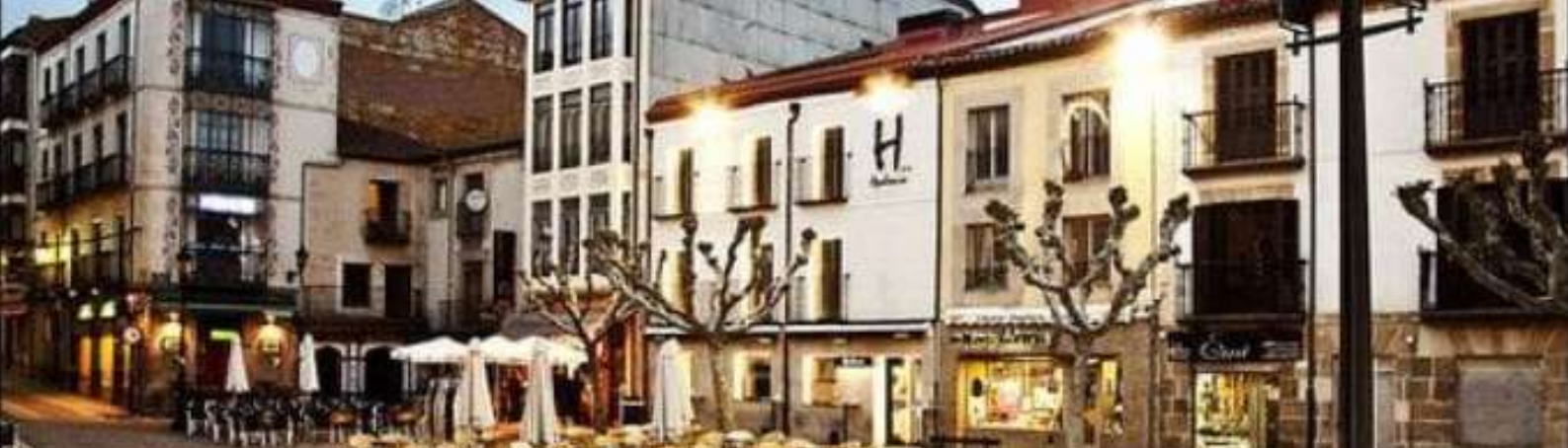
Plaza de Herradores, Soria