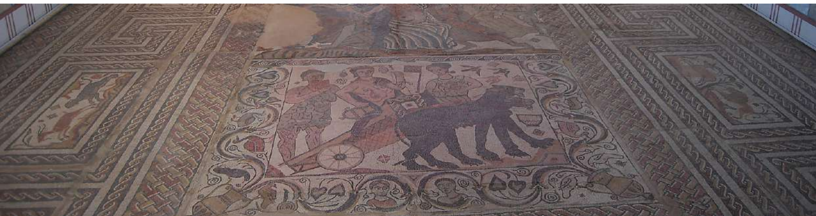
Villa romana Baños de Valdearados, Burgos