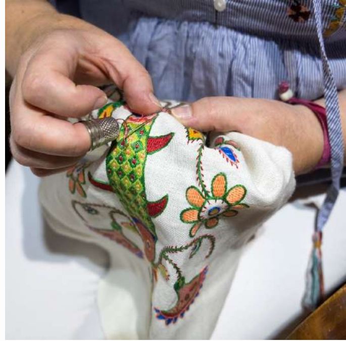
Bordado Serrano, La Aberca, Salamanca

Dentro de la artesanía típica de la Sierra de Francia destaca el bordado, que podemos ver en paños, colchas, manteles... y que forma parte de las señas de identidad de los pueblos serranos. La técnica, los motivos y la selección del colorido se han ido transmitiendo en las familias de forma tradicional de generación en generación. Por lo general los bordados se hacen sobre lienzos de lino o tafetán, utilizando hebras de colores primarios. Los símbolos más recurrentes son: Un corazón del que nace una flor, que representa el amor; El águila bicéfala, que simboliza el matrimonio; La fertilidad que aparece representada por la trucha; El león simboliza al hombre, expresión de la virilidad, y el ave de una sola cabeza, a la mujer; El árbol de la vida envuelve al conjunto y representa la salud y la longevidad. Estas maravillas se exhiben los días de fiesta en los balcones o en fechas como el Corpus Christi en los altares.