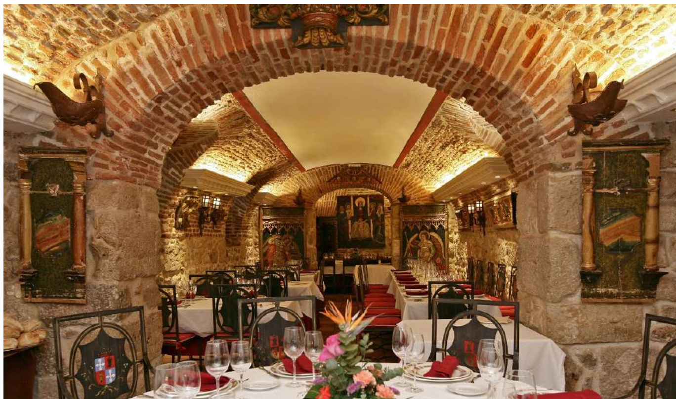
Restaurante La Parrilla de San Lorenzo, Valladolid

Castilla y León posee un rico legado gastronómico, amparado por su extenso y variado recetario, pero igualmente por la calidad y diversidad de su despensa, con más de 60 productos amparados con alguna denominación de calidad. Aunando todo este potencial surge la Marca RESTAURANTE DE LA TIERRA, para que los restaurantes de Castilla y León sean parte directa y activa en la difusión de la excelencia de nuestro turismo gastronómico.