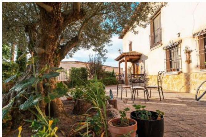
Posada Real La Posada del Canal, Villanueva de San Mancio, Valladolid

Si buscas una experiencia de completa inmersión en la naturaleza y la autenticidad de Castilla y León, te recomendamos las Posadas Reales inuestra marca de calidad dentro del Turismo Rural! No sólo te alojarás en edificios singulares, sino que la excelencia del alojamiento y del trato están garantizadas! Una estancia perfecta para vivir una experiencia inolvidable y sumergirte en todas las actividades, patrimonio y naturaleza de Castilla y León.