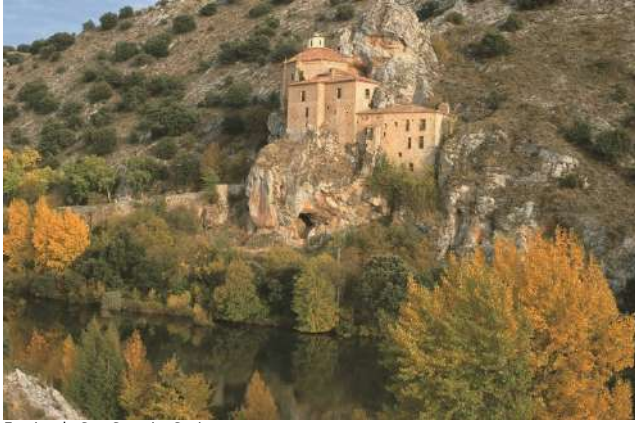
Ermita de San Saturio, Soria