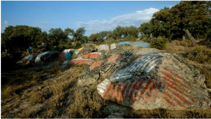
Ibarrola en Garoza, Avila