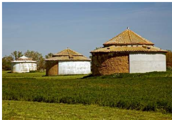
Palomares en Tierra de Campos, Palencia