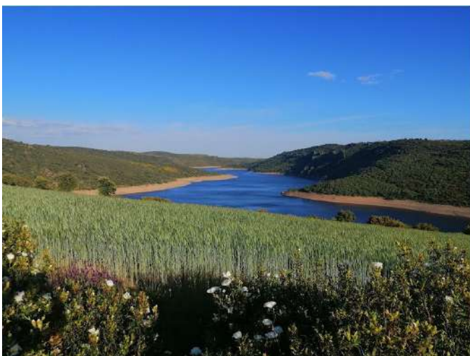
Embalse del Esla, Peña Valdoradas, Carbajales de Alba, Zamora