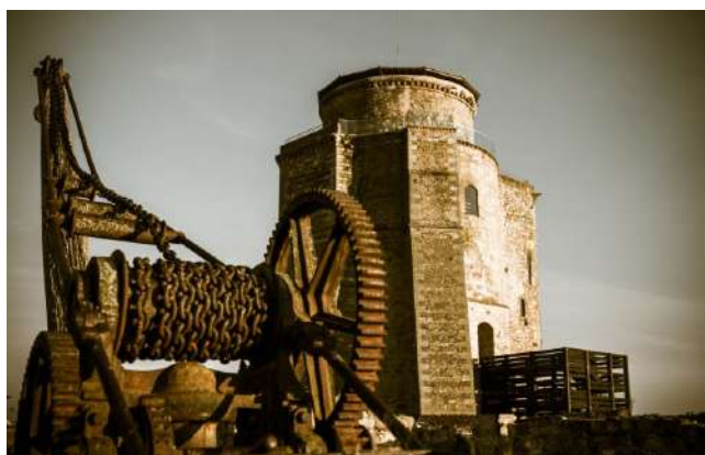
Torre del Homenaje Castillo Duques de Alba, Salamanca

Hoy os invitamos a conocer la torre del homenaje del Castillo de los Duques de Alba. En su interior se pueden visitar varias salas, como la que acoge los frescos de la batalla de Mühlberg y subir al mirador desde donde se visualiza la villa. En el exterior se encuentran las ruinas de las excavaciones arqueológicas que han ido descubriendo el esplendor que llegó a tener el castillo, del que hoy solo se conserva esta torre. En 1429, Juan II de Castilla otorgó Alba de Tormes a D. Gutiérrez Álvarez de Toledo, de la Casa de Alba, que nada más tomar posesión mandó edificar una Torre-Fortaleza. Sus sucesores realizaron obras de ampliación, pero será D. Fernando Álvarez de Toledo, el Gran Duque, con quien el Castillo se engalanó con los mejores mármoles, pinturas y tapices, convirtiéndose en uno de los más suntuosos de España. Sus muros alojaron ilustres huéspedes como Lope de Vega, Calderón de la Barca o Garcilaso de la Vega.