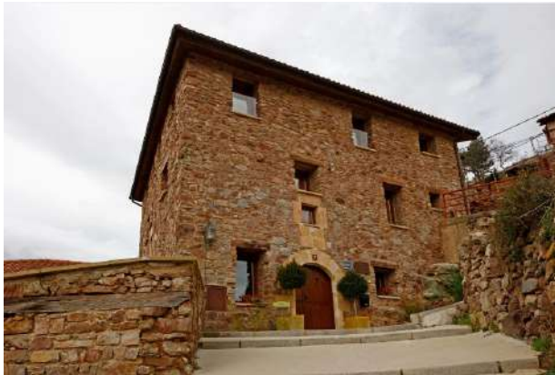
Posada La Almazuela, Montenegro de Cameros, Soria