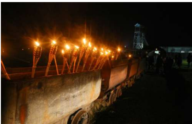
Procesión nocturna de Santa Bárbara, pozo Julia, Fabero, León

La cuenca minera de Fabero, en la comarca del Bierzo, es Bien de Interés Cultural con categoría de conjunto Etnológico. Se compone de un extenso número de enclaves dispersos por dicho municipio de gran interés patrimonial. Uno de los principales es la mina el Pozo Julia, cuya construcción data de 1947. Tras la desaparición de la actividad productiva y su clausura en 1991, los antiguos mineros decidieron mantener viva la memoria de todo lo que supuso la minería en la zona. Y en 2007 sus instalaciones se ceden al Ayuntamiento de Fabero, que lo convierte en un espacio donde exhibir la realidad de la minería de esta cuenca. Se trata de un gran pozo vertical con 275 metros de profundidad, al que se accedía por un castillete con ascensor y vagonetas, y que es la imagen más característica de esta mina. Los visitantes pueden disfrutar en la actualidad de un itinerario de algo más de una hora donde conocerán las condiciones de trabajo de los mineros, además de sus actividades diarias, recorriendo espacios como la lampistería, la zona de facultativos o la sala de compresores con la maquinaria de los años 60, además de una fiel recreación de la mina.