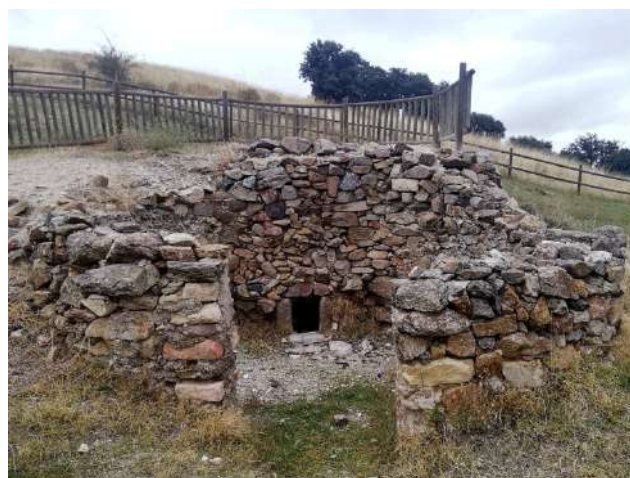
Horno de cal, Vegas de Matute, Segovia

En la falda de la Sierra de Guadarrama se encuentra la población de Vegas de Matute. A las afueras de esta población, encontramos los Hornos de Cal del Zancao, premio de medio ambiente Fuentes Claras, para la sostenibilidad de municipios pequeños. Posiblemente existiera algún otro horno de cal anterior pero es en el siglo XVI, cuando su producción se intensifica para la construcción del monasterio de El Escorial. La fabricación de cal es un proceso sencillo pero la peculiaridad de estos hornos con respecto a otros, es la existencia de portales o solares. Éstos servían de cobijo para el calero, que tenía que administrar el combustible necesario y vigilar la temperatura del horno durante los días que duraba la cocción. De las canteras y montes más cercanos se escogían las piedras más blancas y puras y como combustible se utilizaban los matorrales y retamas, incluso de los pinares del Alto del León. Muy cerca de los hornos más antiguos, se conserva un acueducto que conducía el agua desde la ladera norte de Los Calocos, hasta el pueblo. Para completar nuestra visita a esta población no podemos dejar pasar su iglesia gótica de Santo Tomás de Canterbury, obra de Juan Gil de Hontañón y dos antiguos palacios del siglo XVI.