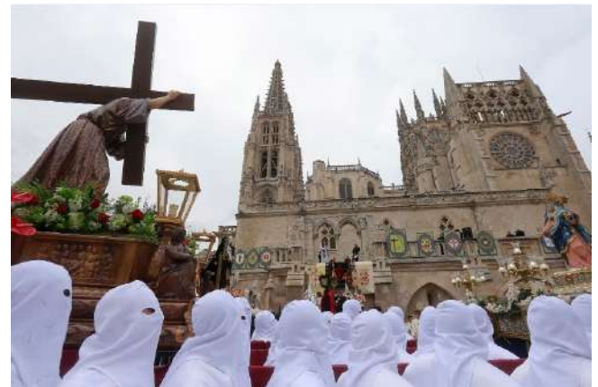
Semana Santa en Burgos