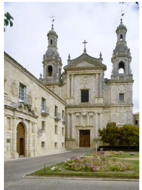
Iglesia La Santa Espina, Valladolid