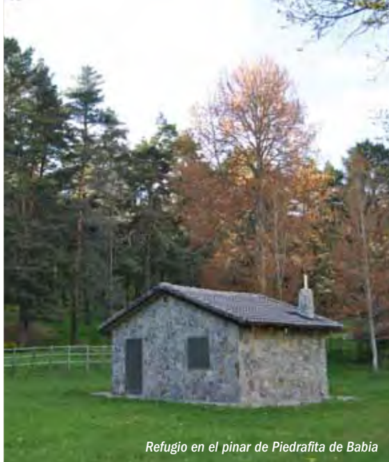
Refugio en el pinar de Piedrafita de Babia

Fecha de declaración: 29 de octubre de 2004 Superficie: 38.146 ha (12.480 ha zona núcleo, 2.924 ha zona tampón, y 22.742 ha zona transición).