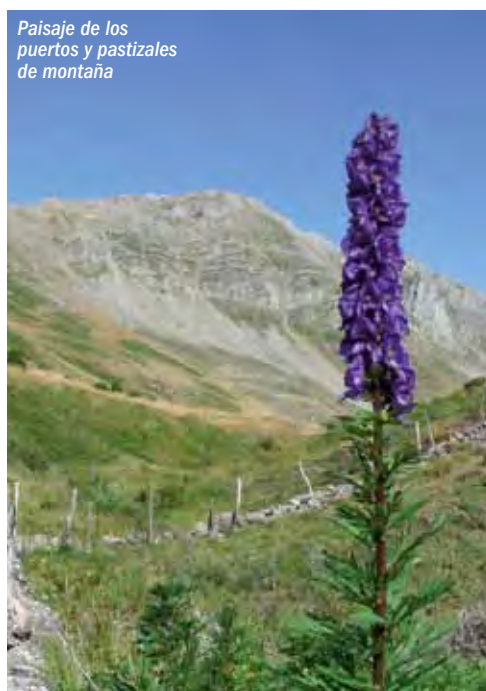
Paisaje de los puertos y pastizales de montaña

Desde la Reserva de la Biosfera se ha intentado mejorar en los últimos años la infraestructura turística a través del mantenimiento y mejora de rutas de senderismo, señalización turística de los núcleos de población y edición de material turístico para su difusión exterior.