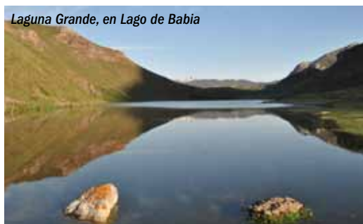
Laguna Grande, en Lago de Babia

Tanto la ganadería como las setas son dos importantes recursos que tienen también su aprovechamiento turístico. A través de jornadas gastronómicas organizadas por la Asociación Estás en Babia , que agrupa a gran parte de los hosteleros de la comarca, se intenta ha-