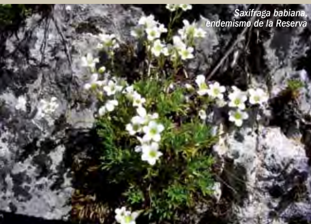
Saxifraga babiana, endemismo de la Reserva

En Babia se localizan numerosos puntos de interés geológico, derivados en su mayor parte del modelado glaciar y fluvial del paisaje. Uno de los puntos más impresionante se puede observar desde el Puente de las Palomas: la captura fluvial del río Luna por el Sil. Ésta se produce por el hecho de que el río Sil debe salvar una fuerte pendiente desde su nacimiento hasta su desembocadu-