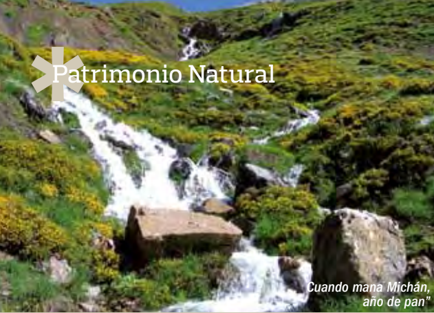
Cuando mana Michán, año de pan"

La configuración topográfica de la comarca viene determinada por la presencia de dos grandes alineaciones montañosas de elevada altura y relieve acusado, con cresterías por encima de los 2.000 metros en gran parte de su recorrido, de dirección este-oeste, y un amplio valle con una altitud no superior a los 1.300 metros, ni inferior a los 1.100, que constituye la vega de los ríos Luna y Sil.