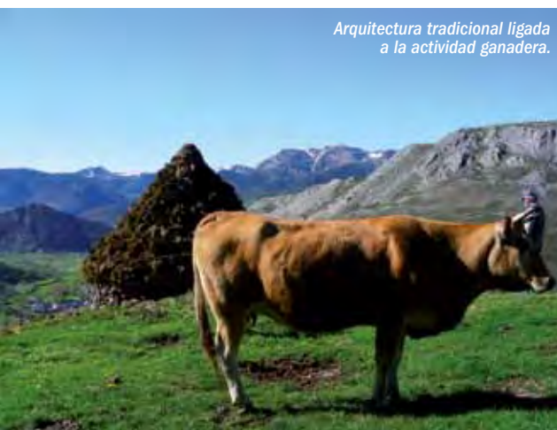
Arquitectura tradicional ligada a la actividad ganadera.

Aún en la actualidad se mantienen en la Reserva explotaciones mineras a cielo abierto, aunque la reestructuración del sector de los últimos años también ha generado su declive y es necesario en este momento recuperar la principal actividad económica de la comarca: la ganadería.