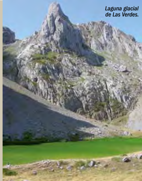
Laguna glacial de Las Verdes.

La declaración de Babia como Reserva de la Biosfera se une a la declaración de Lugar de Importancia Comunitaria (LIC) y Zona de Especial Protección para las Aves (ZEPA), dentro de la Red Natura 2000, y a la próxima declaración como Parque Natural de los Valles de Babia y Luna. En 2009 se crea, impulsado por los Ayuntamientos de Cabrillanes y San Emiliano, el Consorcio para la Gestión de la Reserva de la Biosfera de Babia. Una entidad que da cabida no sólo a estos ayuntamientos, sino también a propietarios y gestores de los montes (juntas vecinales y Junta de Castilla y León), a la Universidad de León, a asociaciones y a empresarios de la zona con el fin de desarrollar proyectos encaminados hacia una gestión y economía sostenible de esta zona de montaña. Buena parte de este desarrollo sostenible pasa por la potenciación de actividades que aúnen la conservación de los modos de vida y de la cultura babiana, pero también la mejora de la calidad de vida. Entre ellas, el mantenimiento de la ganadería trashumante es un objeti-