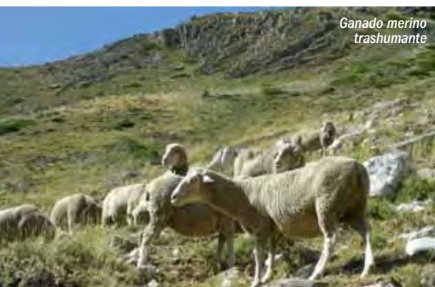
Ganado merino trashumante

Estas prácticas ganaderas han coexistido perfectamente, incluso en íntima dependencia, con algunos taxones vegetales endémicos, quedando de manifiesto en este caso el adecuado equilibrio entre acción antrópica y diversidad biológica.