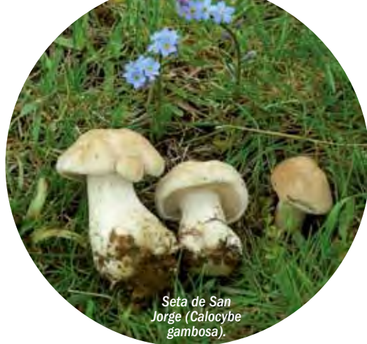
Seta de San Jorge ( Calocybe gambosa ).

cer llegar a vecinos y turistas la calidad de las setas babianas en primavera y la carne de potro Hispano-Bretón en el otoño. Sin embargo, a lo largo de todo el año, es posible disfrutar del rico patrimonio ligado a la trashumancia, como la gastronomía tradicional, definida por la calidad, sencillez y economía de sus ingredientes.