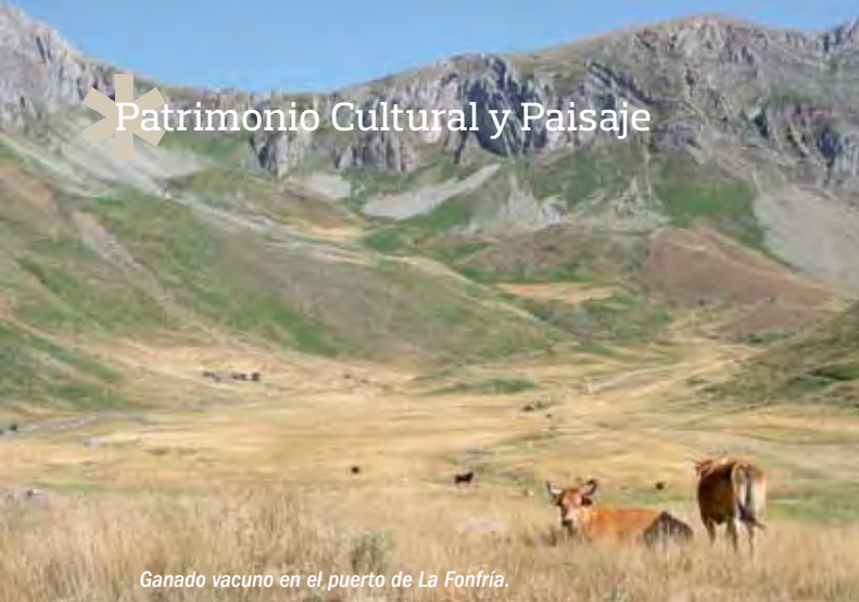
Ganado vacuno en el puerto de La Fonfría.