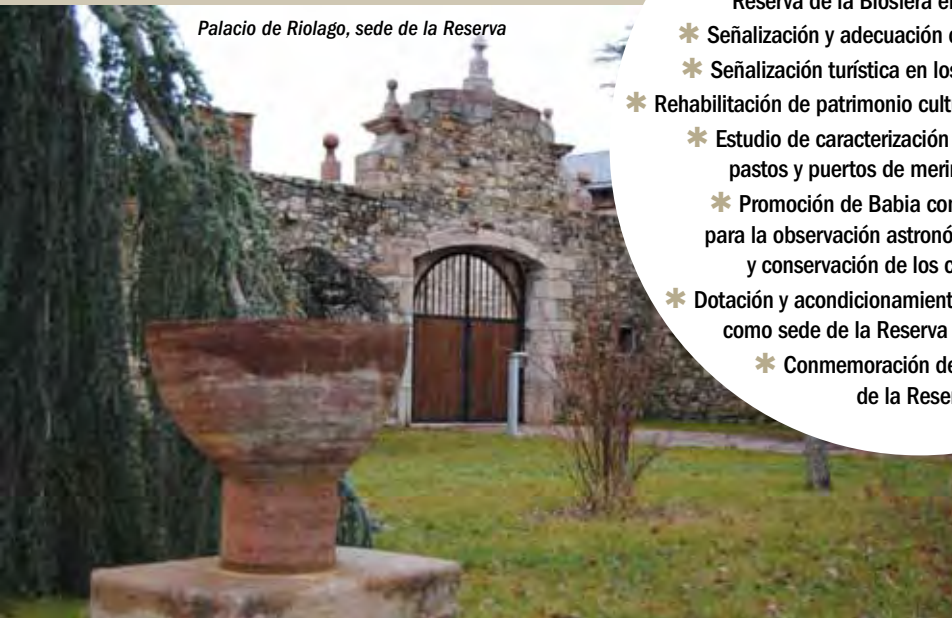
Palacio de Riolago, sede de la Reserva