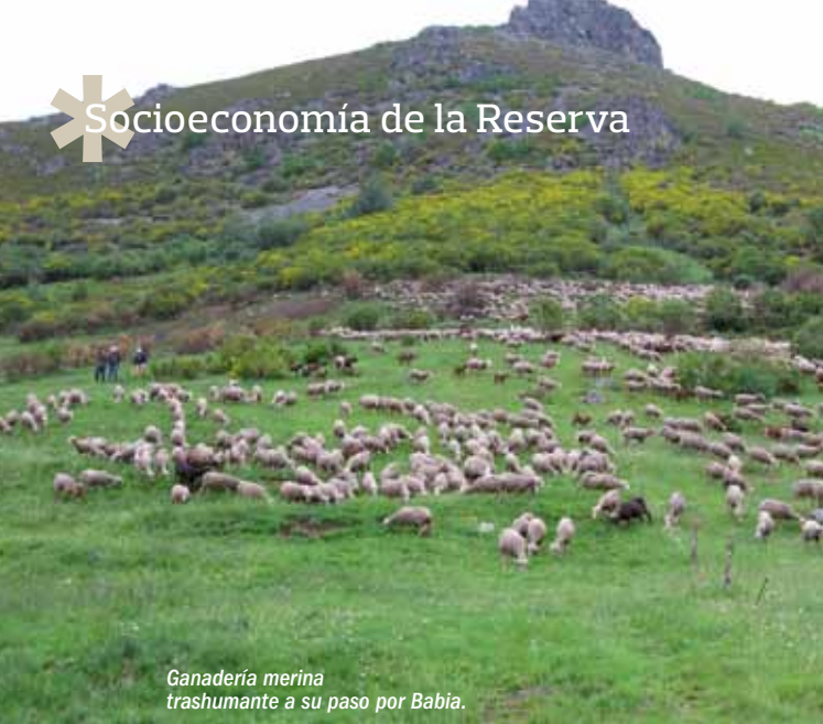
Ganadería merina trashumante a su paso por Babia.