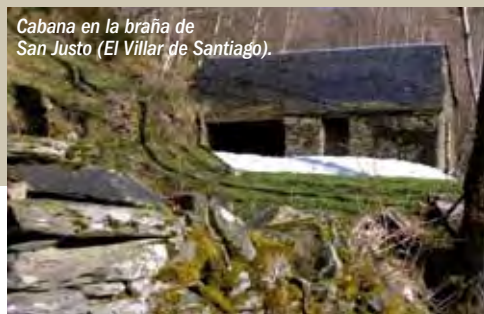
Cabana en la braña de San Justo (El Villar de Santiago).

Por último señalar la existencia del patsuezu, dialecto del asturleonés que, aunque es hablado por muy pocas personas, se mantiene aún en numerosos topónimos y actividades tradicionales, y juegos como las carreras de lecheras, el tiro de sogá o los bolos.