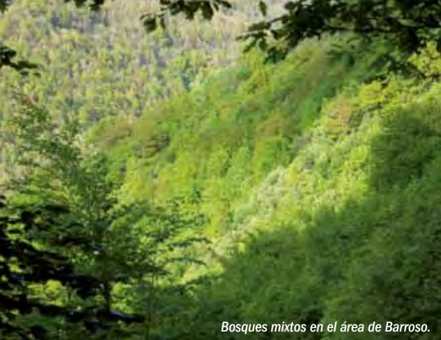
Bosques mixtos en el área de Barroso.

La Reserva es una zona eminentemente montañosa, enclavada en plena Cordillera Cantábrica, con varias cumbres que superan los 2.000 m de altitud. Los pequeños valles afluentes dividen este espacio uniendo las áreas de alta montaña con los prados de las cotas más bajas, situadas entre los 950 y los 1.200 m. En el Valle de Laciana existen diversos puntos de interés geológico, que permiten tener una visión de la evolución geológica y geomorfológica de este territorio. Destacan los abundantes restos glaciares, sobresaliendo las lagunas del Castro y la Tsagunona. Por otra parte, Laciana posee uno de los yacimientos de carbón más importantes del país, explotado desde comienzos del siglo XX.