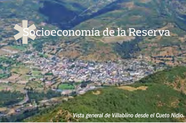
Vista general de Villablino desde el Cueto Nidío.

La población fue creciendo progresivamente, alcanzando un primer pico en 1960 con más de 15.000 habitantes. Después de un ligero descenso, la población del Valle se sitúa en su máximo histórico hacia 1991, con 15.628 personas. Desde ese momento, la población va descendiendo, hasta 1998 de manera lenta y, después, de forma mucho más acusada, ya que entre 1998 y 2009 una media de 390 personas al año han abandonado el municipio. Ese descenso se debe a las progresivas reconversiones que ha sufrido el sector del carbón y en las que se han perdido cientos de empleos relacionados con esa actividad.