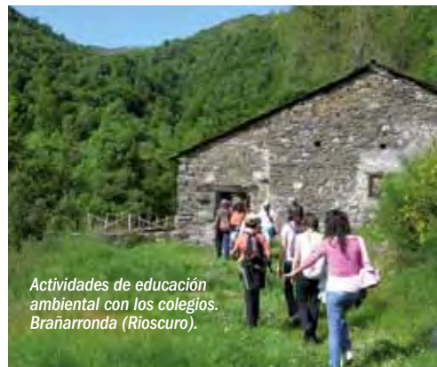
Actividades de educación ambiental con los colegios. Brañarronda (Rioscuro).

El segundo tiene como objetivo potenciar el sector ganadero, dado que esta comarca tiene unas condiciones muy favorables para el desarrollo de esta actividad. Se harán cursos de formación para ganaderos en nuevas tecnologías, ganadería ecológica, etc. Se realizará promoción de los productos ganaderos locales, y se intentará conseguir un sello de calidad para la carne autóctona.