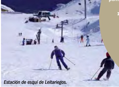
Estación de esquí de Leitariegos.

El Valle de Laciana ofrece al turismo un paisaje de extraordinario valor natural, junto con un patrimonio cultural de gran interés y elementos singulares que se están empezando a poner en valor, como el patrimonio minero o los castros. El núcleo principal es Villablino, dónde se concentran los servicios, así como hoteles, hostales, pubs y restaurantes. Además, existen numerosas casas rurales y albergues repartidos entre las 14 localidades del municipio.