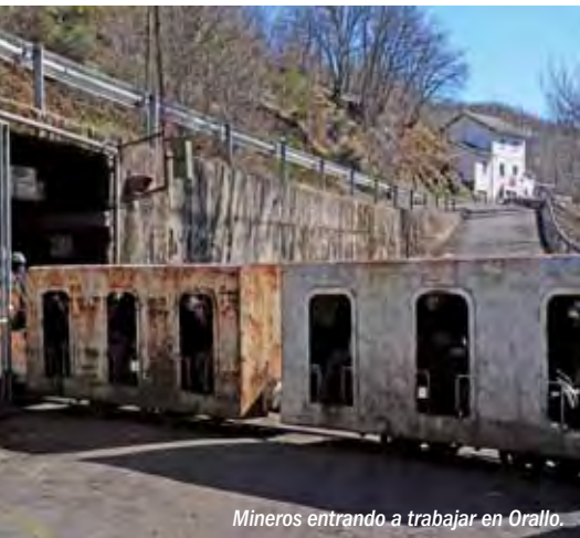
Mineros entrando a trabajar en Orallo.