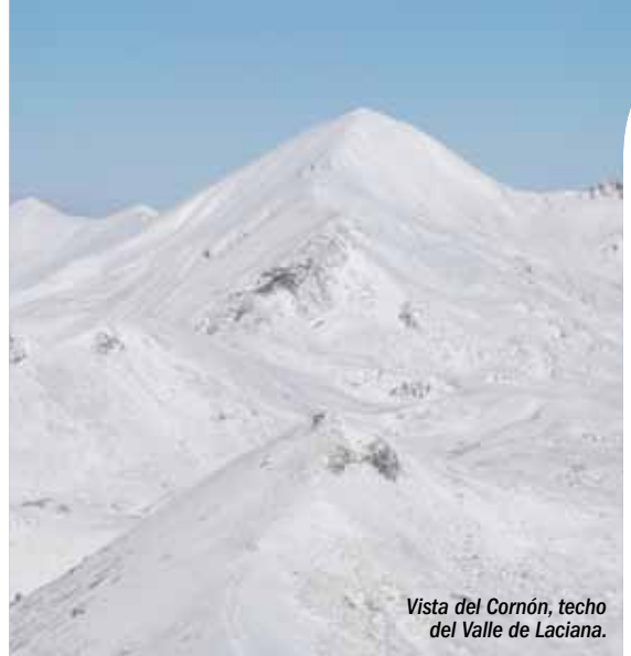
Vista del Cornón, techo del Valle de Laciana.

Fecha de declaración: 10 de julio de 2003