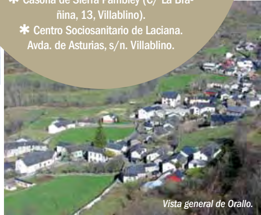
Vista general de Orallo.

de las Rutas de Bicicletas de Montaña por las cuencas mineras, que recorren el norte de las provincias de León y Palencia. En estos momentos se están señalizando tres rutas cicloturistas en la comarca de diferente grado de dificultad.