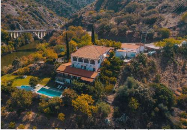
Posada Real Quinta de la Concepción, Salto de Saucelle, Salamanca