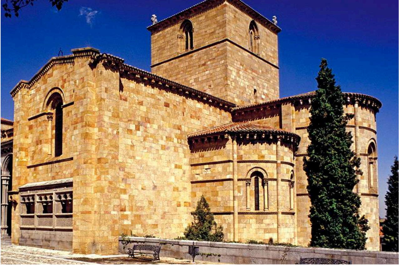
Basilica de San Vicente, Ávila

La visita a la ciudad medieval debe iniciarse con un recorrido por el mejor ejemplo de arquitectura militar del románico español y un modelo único de construcción medieval europea, Las Murallas, construidas en granito y que sirvieron como defensa militar, frontera fiscal y soporte de otras arquitecturas.