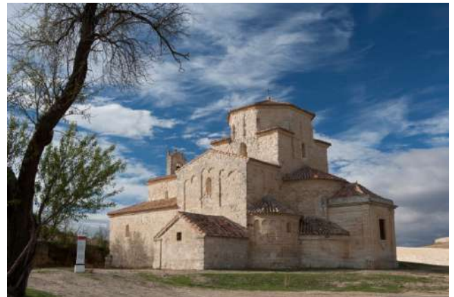
Iglesia de Urueña, Valladolid

Una aldea medieval de la provincia de Valladolid, a la cual, en el año 2007, se la otorgó el sello de villa del libro por ser el pueblo con más librerías de toda España, ni más ni menos que 12. Desde el 2013, pertenece a la asociación de los pueblos más bonitos de España. Esto se debe, en gran parte a su encanto, al estar casi en su totalidad rodeado por una muralla del siglo XIII, un castillo adosado a esta y al tener las calles empedradas. El acceso al pueblo es a través de la puerta de la villa y de la puerta del azogue. También podemos pasear por el adarve de la muralla para ver a un lado el precioso pueblo y al otro el imponente campo de castilla. En 1975 fue declarada Conjunto histórico-artístico. No nos podemos olvidar de sus cinco museos dedicados a la música y a la cultura. Para completar la visita, nos desplazamos hacia las afueras para ver la ermita de la anunciada, única iglesia de estilo románico-lombardo de Castilla y León, sus fiestas patronales se celebran el 25 de marzo y la romería el 8 de septiembre.