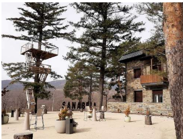
Posada Real Villa Lucerna Sports&Hotel Resorts, Galende, Zamora