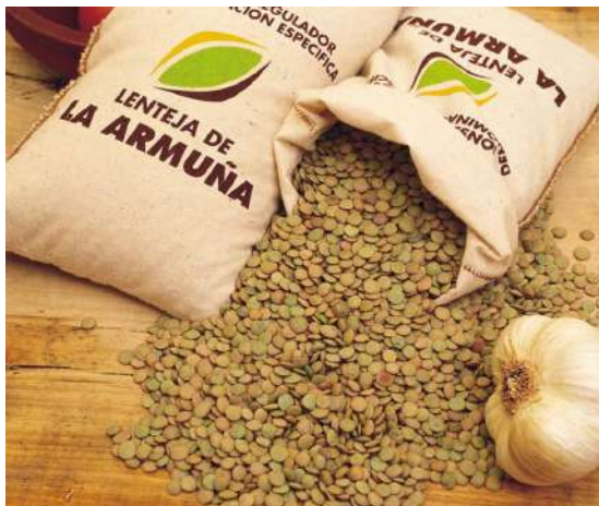
Lenteja de la Armunia, Salamanca