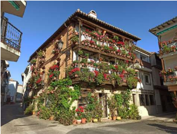
Museo Juguete Hojalata, Candeleda, Ávila