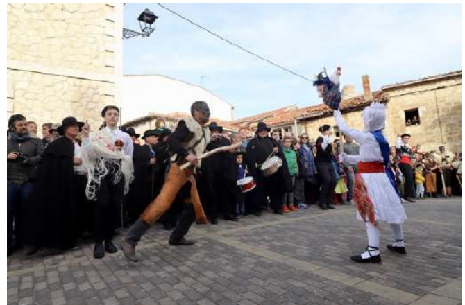
Corrida del Gallo de Carnaval, Mecerreyes, Burgos

El domingo de carnaval en Mecerreyes, tiene lugar la Corrida del Gallo, sin duda alguna la fiesta carnavalesca más singular de las que se celebran en la provincia de Burgos, declarada de Interés Turístico Regional. En la fiesta participa todo el pueblo, cantando, bailando y saliendo a por el Gallo. Aunque hay personajes que destacan y que tienen un papel más importante, ataviados con curiosos disfraces. El Gallo: personaje y alrededor del cual gira la fiesta. En los últimos años se usa uno de trapo. El Rey: Niño de unos 10 años, que lleva al gallo y se coloca en el centro de la calle, para que los mozos entren a por el gallo. Zarramaco: Mozo vestido con pieles y cencerros, encargado de defender al gallo de los mozos. Danzantes: mozos que flanquean al Rey, danzan al son de las dulzainas y el tamboril. Alguaciles y Mozo mayor: Son los encargados de hacer respetar las normas, guardar las filas, etc. Además la localidad cuenta con un curioso museo temático sobre el Carnaval.