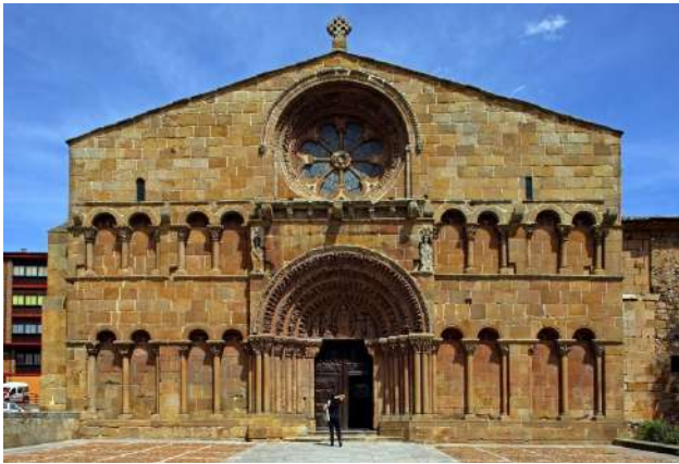
Iglesia de Santo Domingo, Soria

De las 35 collaciones o parroquias románicas que dieron lugar a la ciudad de Soria se mantienen buenos ejemplos que dan testimonio de este arte medieval. En el área del río Duero encontramos uno de los ejemplos más originales del románico español: Claustro e iglesia de lo que fue el antiguo monasterio de San Juan de Duero. Un poco más alejado, en el paseo dirección a la ermita de San Saturio, el monasterio de San Polo. Subiendo al centro ciudad destaca el magnífico claustro de la Concatedral de San Pedro así como lo que queda de la que fuera iglesia de San Nicolás, ahora espacio cultural. Las Iglesias de Santo Domingo y de San Juan de Rabanera, con su portada y ábside respectivamente, son también obras muy significativas del románico español que nos encontramos el recorrido por el casco histórico de la ciudad.