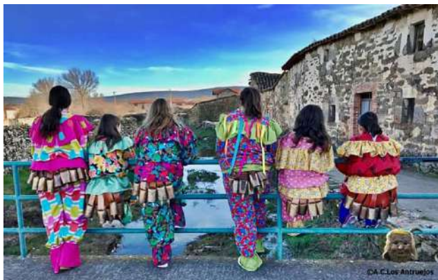
Carnaval Villanueva de Valrojo, Zamora

Llegar a Villanueva de Valrojo una tarde entre el Domingo y el Martes de Carnaval es oír sonidos de cencerros y ver a personajes vestidos de coloristas disfraces, bien arlequinados y floreados, combinados entre sí, son los Cencerros. En una casa o pajar se depositan todos los trajes y los cencerros. Amigos o amigas se disfrazan, lo combinan como quieren, ponen los cencerros correr las calles, amenazando con sus tenazas articuladas, con sus tornaderas de madera, con látigos, con escobas, con simples palos o con las manos. El Lunes de Carnaval es la tarde que disfrazados, salen a pedir el aguinaldo por todo el pueblo. Se mantiene en muchas casas darlo en especie: unos huevos, un chorizo, una botella de vino,..., que esa misma noche se comerán en alegría festiva. El Martes de Carnaval: recorrido por las calles del pueblo, pero con un aliciente nuevo e inesperado. Montar "un número", sobre temas de actualidad y lo escenifican en el pabellón multiusos de la localidad, en el que tienen lugar los bailes nocturnos. Es el punto final de las fiestas con la aparición efímera de los Diablos. Como almas en pena, hacen su aparición casi al final del baile, tres Diablos, con máscaras de corcho, apliques de hojalata y cuero, capas pardas y aspecto fúnebre, llevando tornaderas y un caldero con azufre ardiendo, sin hablar. Es el fin de la fiesta. Llega la Cuaresma.