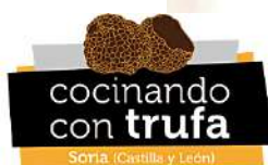
Trufa de Soria