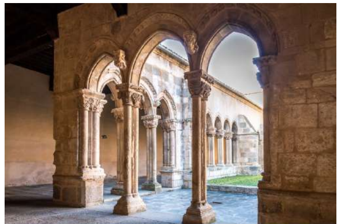
Claustro Santa María la Real de Nieva, Segovia