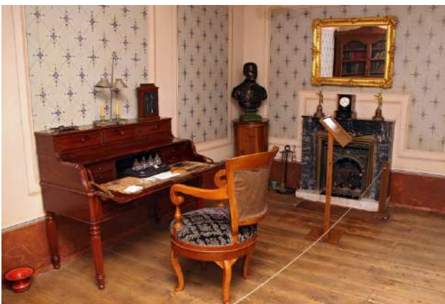
Casa Museo Sierra-Pambley, León

La Casa-Museo Sierra Pambley se ubica en plena Plaza de Regla, frente a la Catedral de León. Es una antigua casona del siglo XIX de un rico ilustrado de la época. Se trata de uno de los mejores ejemplos de casa burguesa en la que se reúnen las innovaciones del momento. El visitante que se acerque podrá conocer de primera mano todas las estancias de la vivienda, conservadas de tal modo que parece que no ha pasado el tiempo, además de la curiosa historia de la familia, cuyo primer propietario dedicó todos sus esfuerzos en agradar a su sobrina, con la que finalmente no pudo contraer matrimonio. Otra de las casas-museo de la ciudad de León es la Casona de los Pérez, actual Museo de la Emigración Leonesa. El proyecto de esta casa señorial es realizado por Manuel de Cárdenas en 1925 como vivienda familiar del afamado carpintero Miguel Pérez Vázquez. La casona cuenta con frisos tallados a imagen de la sillería del coro de San Marcos, además de otros estilos como su decoración art decó y papeles pintados de inspiración japonesa.