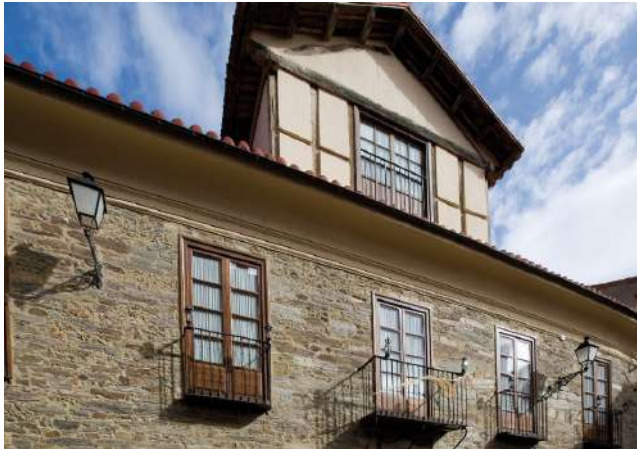
Posada Real Casa de Tepa, Astorga, León