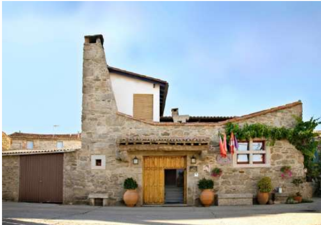
Posada Real La Mula de los Arribes, Villardiegua de la Ribera, Zamora