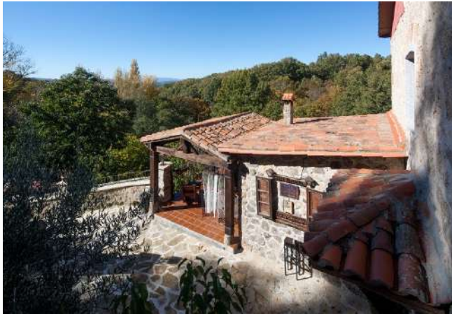
Posada Real Ruralmusical, Puerto de Béjar, Salamanca