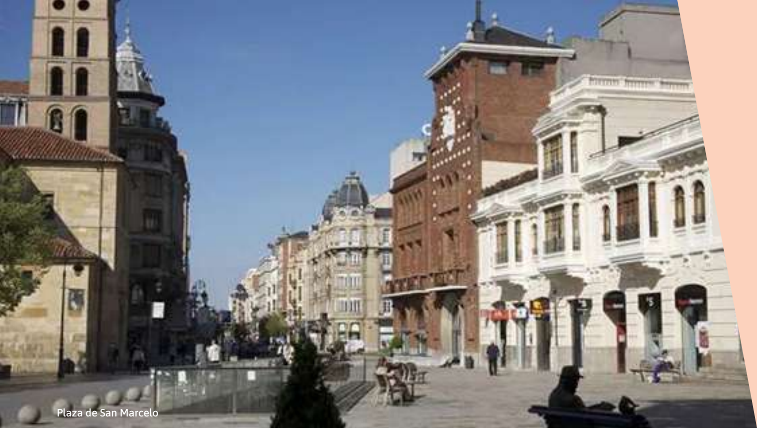
Plaza de San Marcelo

MIÉRCOLES 8 DE JULIO [ 21:30 H ] PLAZA DE SAN MARCELO. LEÓN