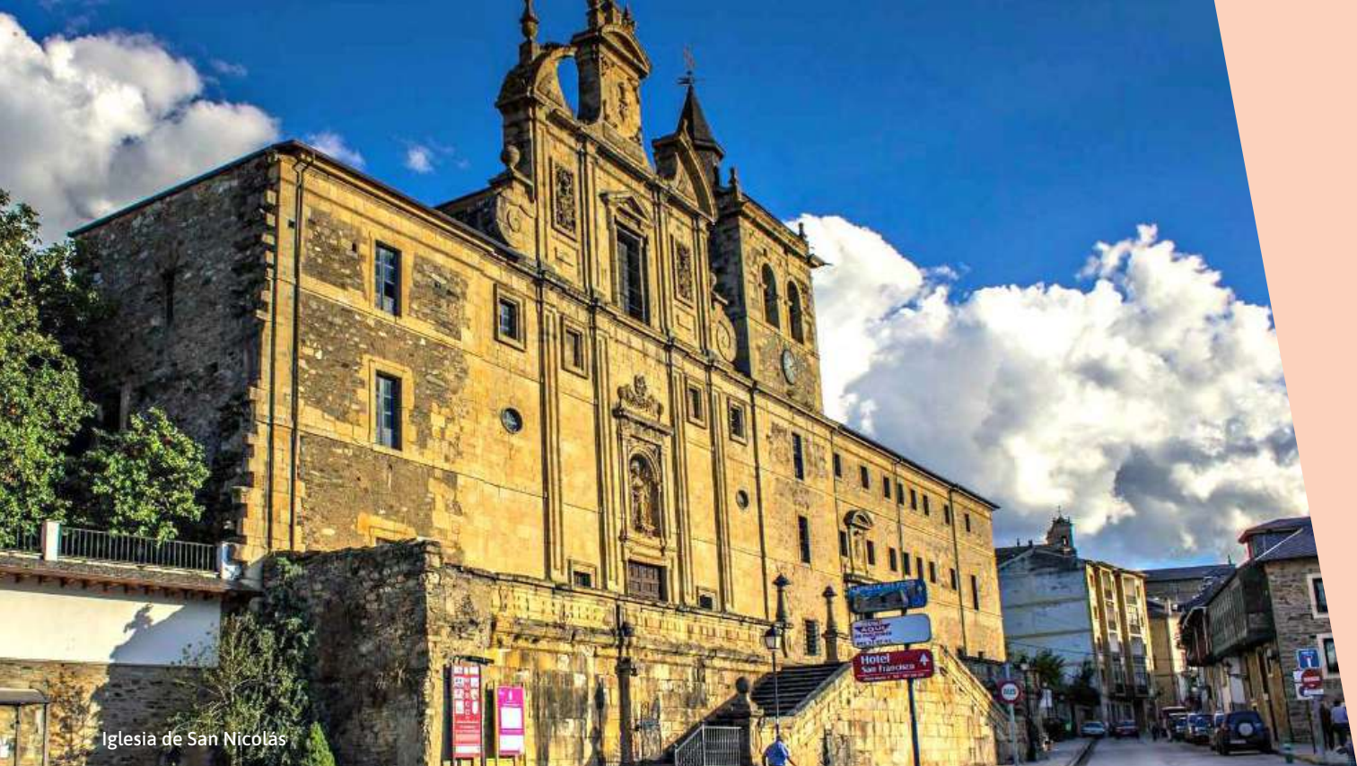
Iglesia de San Nicolás

MARTES 7 DE JULIO [ 21:00 H ] IGLESIA DE SAN NICOLÁS VILAFRANCA DEL BIERZO [LEÓN]