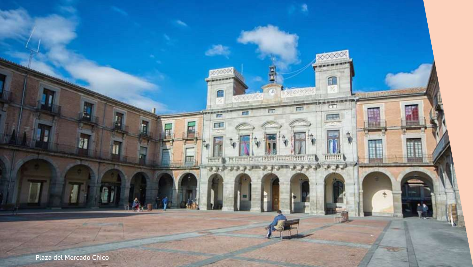
Plaza del Mercado Chico

DOMINGO 5 DE JULIO [ 21:30 H ] PLAZA DEL MERCADO CHICO. ÁVILA