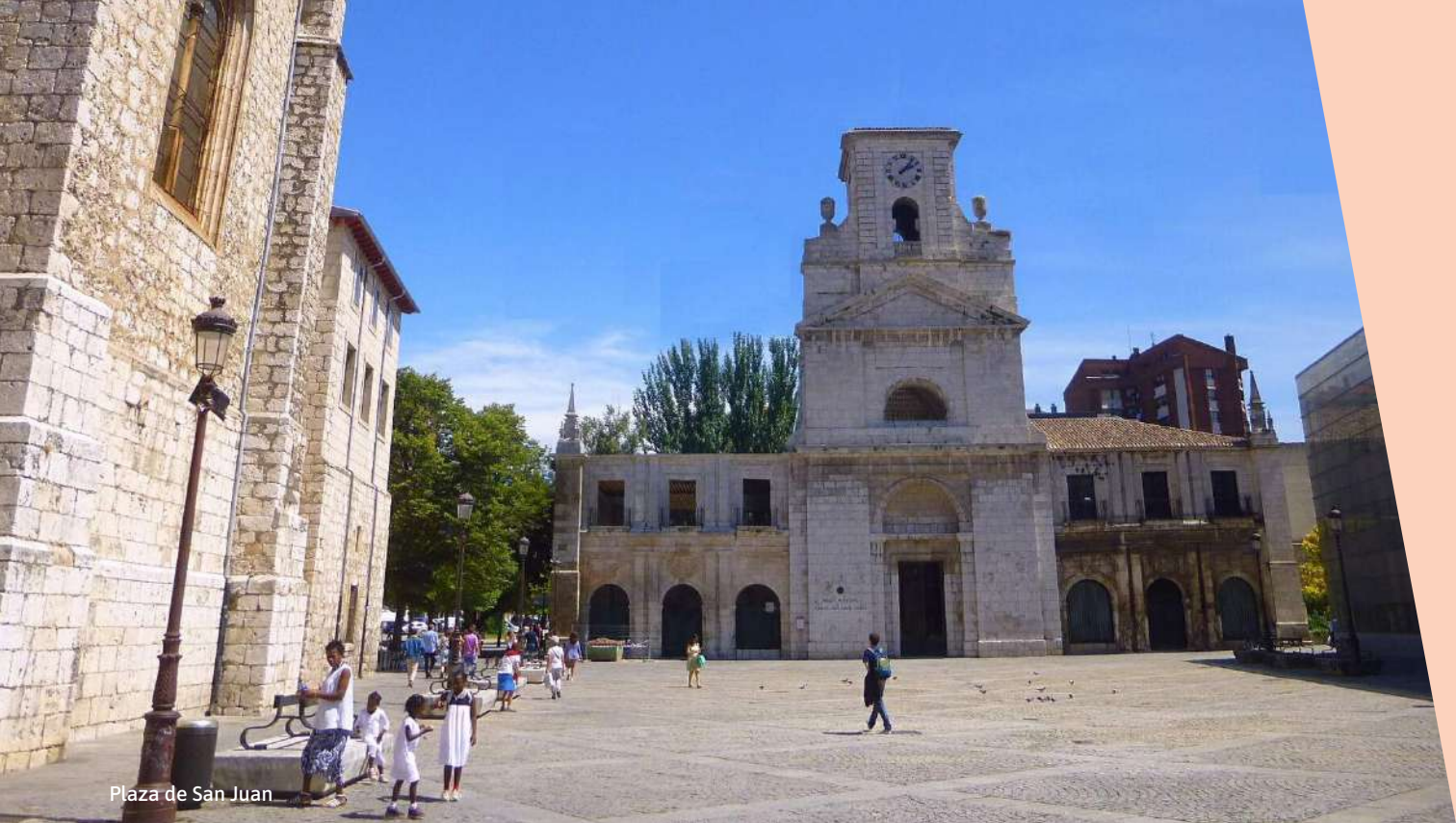
Plaza de San Juan

VIERNES 10 DE JULIO [ 21:00 H ] PLAZA DE SAN JUAN. BURGOS