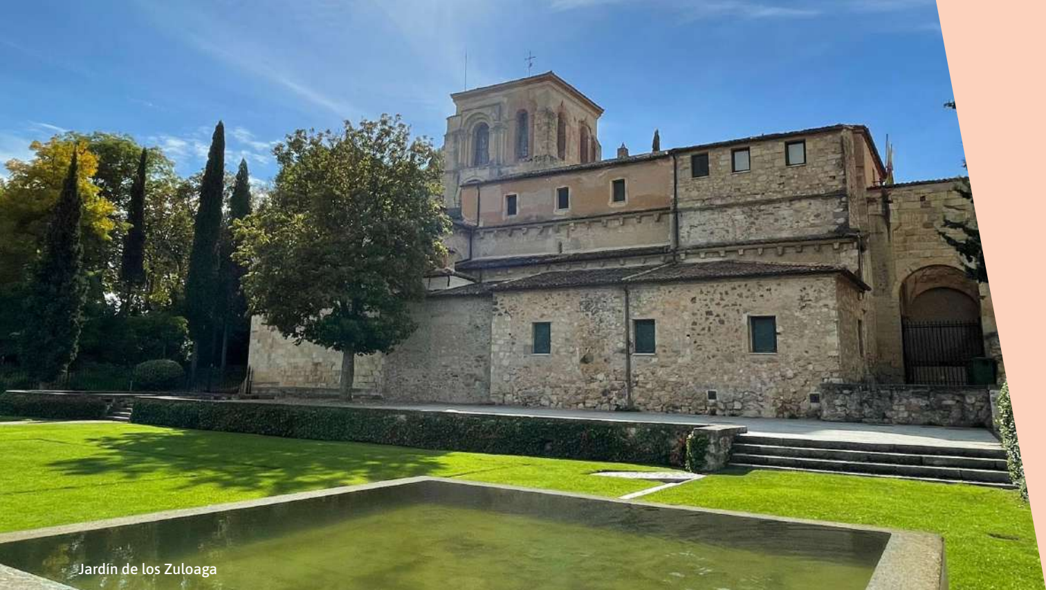
Jardín de los Zuloaga

JUEVES 16 DE JULIO [ 22:00 H ] JARDÍN DE LOS ZULOAGA. SEGOVIA