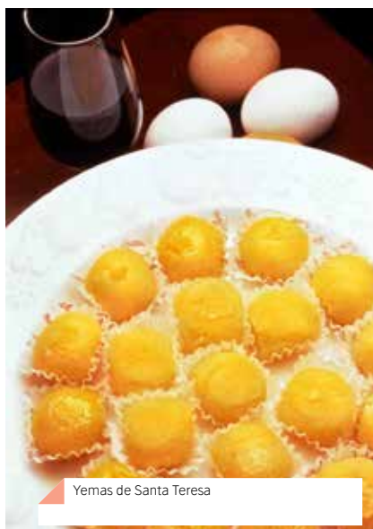
Yemas de Santa Teresa

Ávila, ciudad Patrimonio Mundial, mantiene las tradiciones de Semana Santa y, además, ha incorporado en los últimos años nuevos actos. Junto con el tradicional 'Vía Crucis' en torno a la muralla en las primeras horas del Viernes Santo, en fechas más recientes han visto la luz procesiones como la de la Estrella, que se suman a tallas de veterana devoción como el Cristo de Medinaceli o el de las Batallas que procesiona el Miércoles Santo, sin olvidar el Miserere del Martes Santo por la noche.