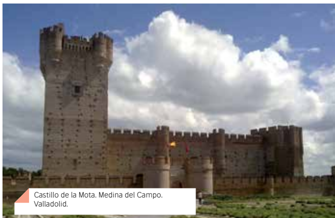
Castillo de la Mota. Medina del Campo. Valladolid.

destacan Nuestra Señora de las Angustias o el Nazareno de la Cruz. Medina del Campo cuenta con las procesiones de disciplina más antiguas de España de las que ya ha celebrado su VI Centenario y con este motivo inauguró el Centro San Vicente Ferrer como Centro de Interpretación de la Semana Santa de España.