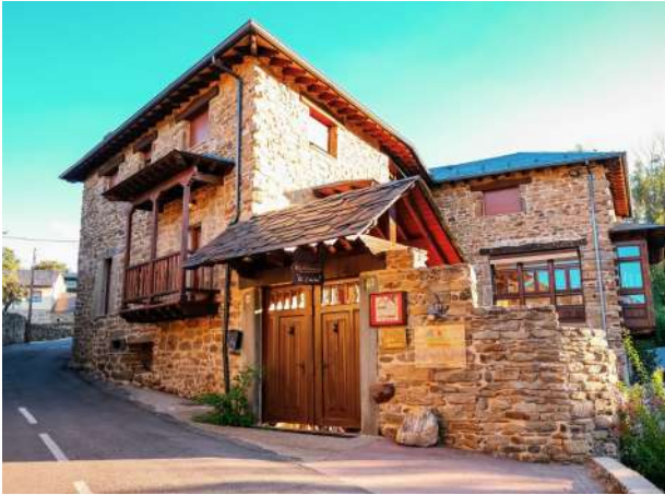
Posada Real El Sendero del Agua, Trefacio, Zamora