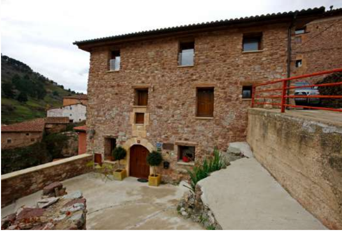
Posada Real La Almazuela Montenegro de Cameros, Soria