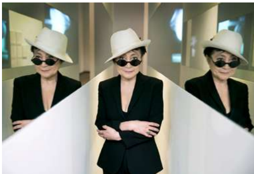
Yoko Ono con su instalación En Trance , 1997, en Yoko Ono: Half-a-Wind Show , Louisiana Museum of Art, 2013.

La exposición Yoko Ono. Insound and Instructure celebra la relevancia y trascendencia de la obra de esta artista pionera del arte conceptual y participativo, el cine experimental y la performance , música y activista por la paz mundial.